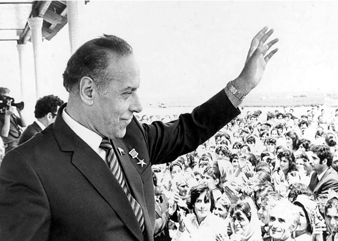
Öndər Heydər Əliyev 1993-cü il iyunun 9-da Naxçıvandan Bakıya