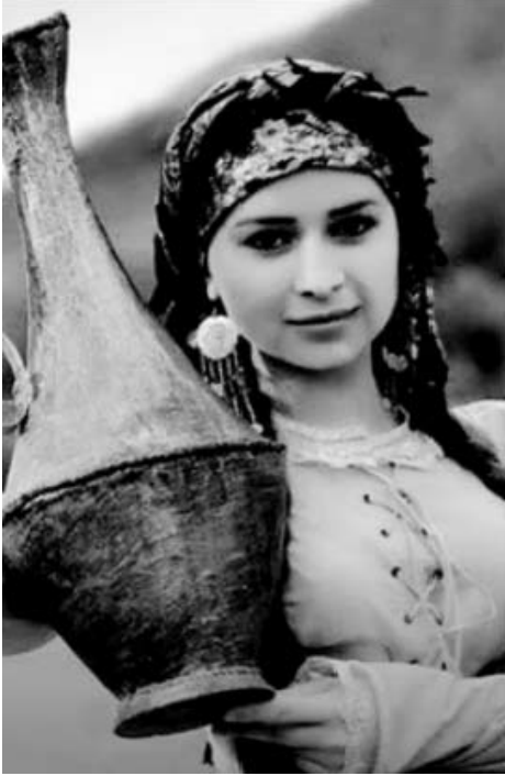
Əvvəli Səh. 10

Beləliklə, səhəng həm də əsrlərin sevgisinin şahidi bir əşyadır. Onun içərisində daşınan su neçə-neçə gənclərin qovuşmasına, sevgilərinin bir ailədə birləşməsinə şahidlik edib. Bəhs etdiyimiz bulaqlar neçə-neçə gənc qız-oğlanın görüş yeri olub. Onlar bulaq başında bir-birinə vəd verib, su haqqı ilə and içib, su kimi pak hisslərlə bir-birinə yanaşıblar. Bir-birinin yolunu su yolu kimi gözləyiblər. Şairə Sədaqət Dilqəmçinin misralara naxışladığı kimi: