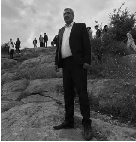
Əvvəli səh. 5

8 ailə tamamilə məhv edildi, 25 uşaq hər iki valideynini və 130 uşaq isə bir valideynini itirdi, 56 nəfəri xüsusi qədərliklə - diri-diri yandırılaraq, başının dərisi soyularaq, boynu vurularaq, gözləri çıxarılaraq, hamilə qadınların isə qarın boşluğuna süngü ilə vurularaq öldürüldü. Xocalı soyqırımını Bosniya və Herseqovina, Kolumbiya, Çex Respublikası, Honduras, İordaniya, Meksika, Pakistan, Panama, Peru, Sudan, Cibuti, Qvatemala, Paraqvay, Sloveniya, Şotlandiya, İndoneziya və Əfqanıstanın qanunverici orqanları tərəfindən müvafiq parlament qətnamələri qəbul edib. Xocalı soyqırımı ABŞ-in 40-dan çox ştatının qanunvericilik qurumları və qubernator proklamasiyaları səviyyəsində tanınıb. 2013-cü ilin fevral ayında Qahirədə keçirilən İslam Əməkdaşlıq Təşkilatının Zirvə Konfransının 12-ci sessiyasında qəbul olunan Yekun Kommünikədə üzv dövlətlər Xocalı soyqırımının tanınması istiqamətində zəruri səylər göstərməyə çağırıblar. Avropa İnsan Hüquqları Məhkəməsi 22 aprel 2010-cu il tarixli qərarında Xocalının azərbaycanlılardan ibarət mülki əhalisinin qırılmasını "müharibə cinayətləri və ya insanlığa qarşı ci-