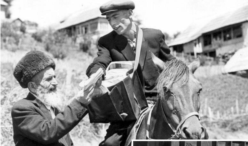
Əvvəli Səh. 10

Rabitənin, poçt daşınmalarının gecikməməsi üçün poçtalyonlar poçt şöbələrinin yaxınlığında evlə təmin olunurdular, bu mənzillər adətən dövlət balansında olan çoxmənzilli binalardan ayrılırdı. Şəhərin mərkəzində evi olan poçtalyonlar kifayət qədər çox idi. Rayonlarda, kəndlərdə poçt şöbələri tikilərkən binanın yanında mütləq poçtalyon üçün mənzil də inşa edilirdi. Çətin bölgələrdə işləyən poçtalyonlar üçün maaşdan əlavə ödənişlər olurdu, onlar atla, motoskl, velosipedlə təmin olunurdular. İlboyu gərgin işləyən poçt işçilərinin məzuniyyətini sanatoriyada keçirməsi üçün putyovka-göndəriş verilirdi. Poçtalyonlar "Əməkdar rabitəçi", "Sosialist əməyi qəhrəmanı" fəxri adı, "Qırmızı əmək bayrağı ordeni", "Fəxri fərman" və s. mükafatlarla təltif edilirdi.