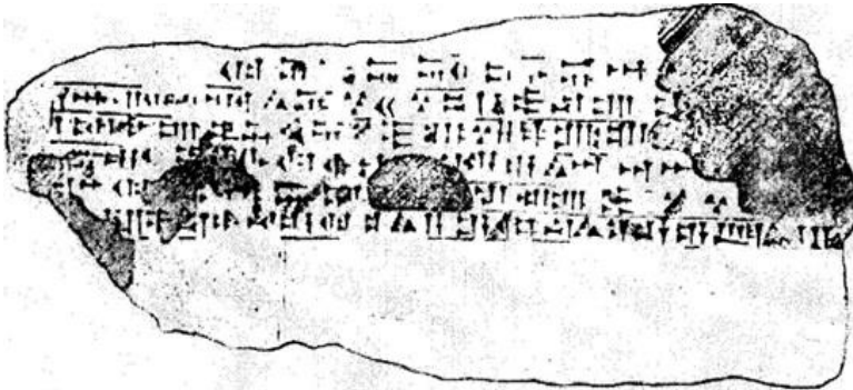
Şəkil 1. İşpuini və Menuanın Qalatgah qayaüstü kitabəsi