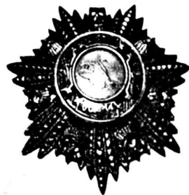
Şəkil 1. III dərəcəli Məcidi nişanı