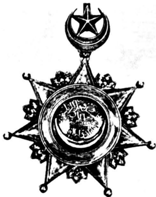
Şəkil 3. II dərəcəli Osmani nişanı