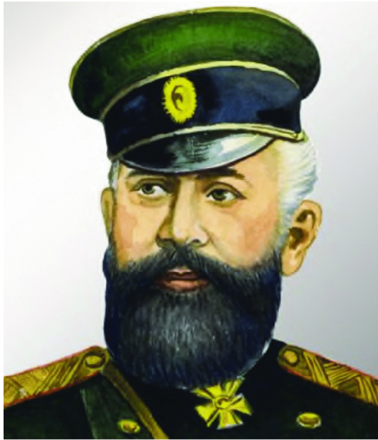
"Nə bahasına olur-olsun, Hərbiyyə naziri general Səməd paşa Mehmandarlı ilə təmas qurmaq lazımdır. Ona hamımızın son damla qanımıza qədər düşmə-nə qarşı çarpışmağa hazır olduğumuzu ərz edəcəm, zabitlərimizin apoleti haqqında əmrlərini gözlədiyimizi açıqlayacaqsan".

Aldığım əmrləri olduğu kimi əsgəri üsula görə təkrarladım. Generalin əmrinə görə məiyyətimə bir zabit yoldaş da almalı idim.