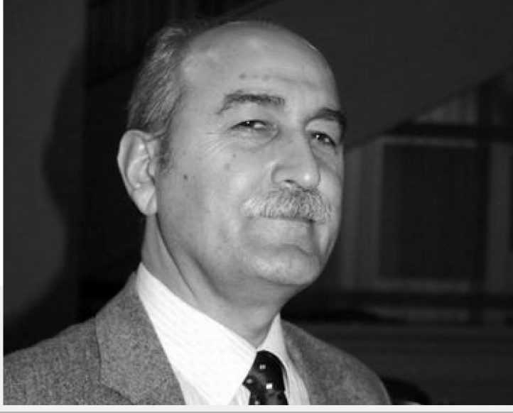
(əvvəli ötən sayımızda)

Altaylarla Anadolu arasında baş verən ilk köçlər iki istiqamətdə gerçəkləşmişdir. Batıya doğru hərəkət edənler Altaylardan Xəzərin qzeyi istiqamətindən Anadolu və Mesopotamiyaya doğru istiqamətlənmişlər. Xəzər dənizinin güneyi tərəfdən baş verən köç ilkin və daha qədimdir. Bu istiqamətdə baş verən köç Sumer, Mari və Elam kimi üç ana mədəniyyətin təməlini təşkil edən qruplardır. Hiksos, Kassı və Luristanın dəmirçiləri kimi digər mədəniyyətlər üç ana mədəniyyətin içərisindən ayrılmışlar. İkinci köç Xəzərin qzeyindəki bozqır üzərindən baş vermişdir. Bu istiqamətdə miqrasiyanı həyata keçirənler Hatti və Hurri xalqlarının ataları idilər. (Semih Güneri. 2018, Səh. 705)