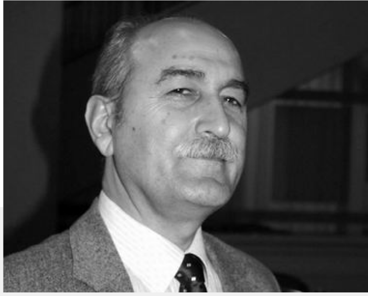
(əvvəli ötən sayımızda)