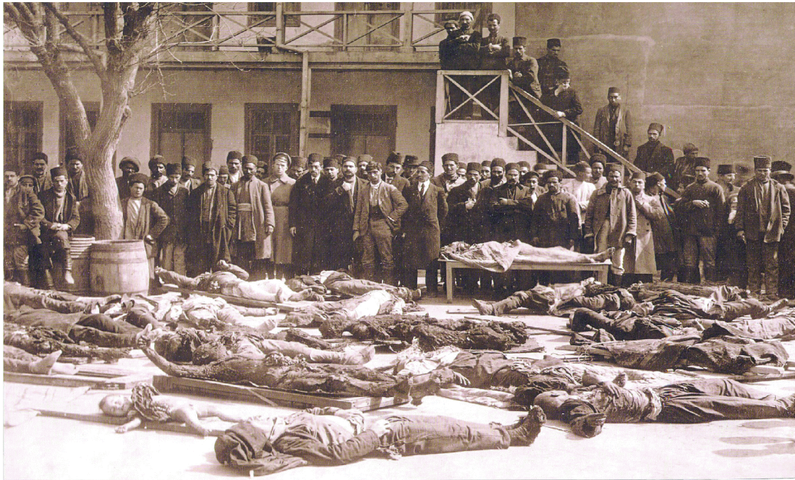
halını almışdır... (Cild 2, səhifə 333, 369, Peterburq, 1904).

"Ümumi bəşəriyyət tarixi" ermənilər haqqında belə deyir: "Erməni xalqı öldürücü bir parazit kimi olmuşdur. Öz ruhu və əxlaqı ilə böyük millətlərin vücudunda rəhna açmağa çalışır... Mənfi bir kütlə