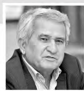
(əvvəli ötən sayımızda)