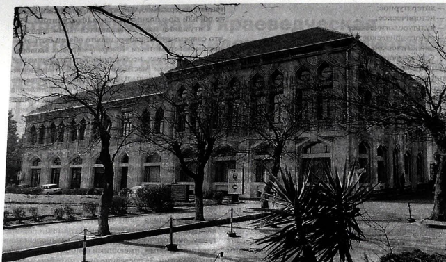
Президентская библиотека Управления делами Президента Азербайджанской Республики

и понятий. В разделе «Ученые-экологи» можно найти биографические и библиографические данные о 60 ученых-экологах Азербайджана. В разделе «Экологический календарь» перечислены знаменательные даты и события, связанные с окружающей средой и отмечаемые как за рубежом, так и в Азербайджане.