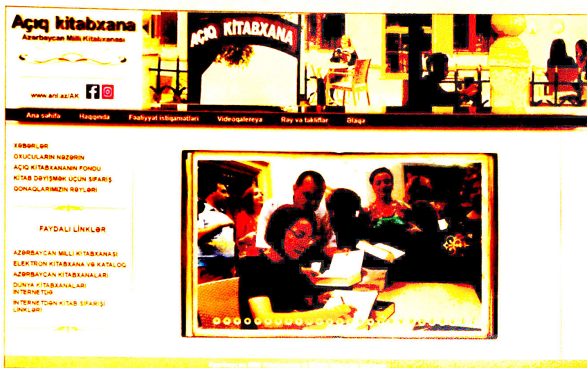
Сайт проекта «Открытая библиотека – пространство свободного чтения» АНБ им. М.Ф. Ахундова ( http://anl.az/AK/index.php )

В библиотеке нового типа, каковой можно считать и АНБ, созданы все условия для беспрепятственного доступа читателей к электронной библиотеке и ее каталогу. Виртуальная библиотека азербайджанской литературы и читальные залы полностью оснащены современным компьютерным оборудованием и бесплатной сетью Wi-Fi. Читатели могут заказать литературу, изданную в России, Турции и других странах. С целью улучшения качества электронных услуг и повышения уровня обслуживания функционирует сайт «Открытой библиотеки», который дает возможность виртуального заказа литературы и ознакомления с ней. Читатели также всегда в курсе всех проводимых мероприятий. При помощи автоматического книжного киоска можно организовать и книгопродажу.