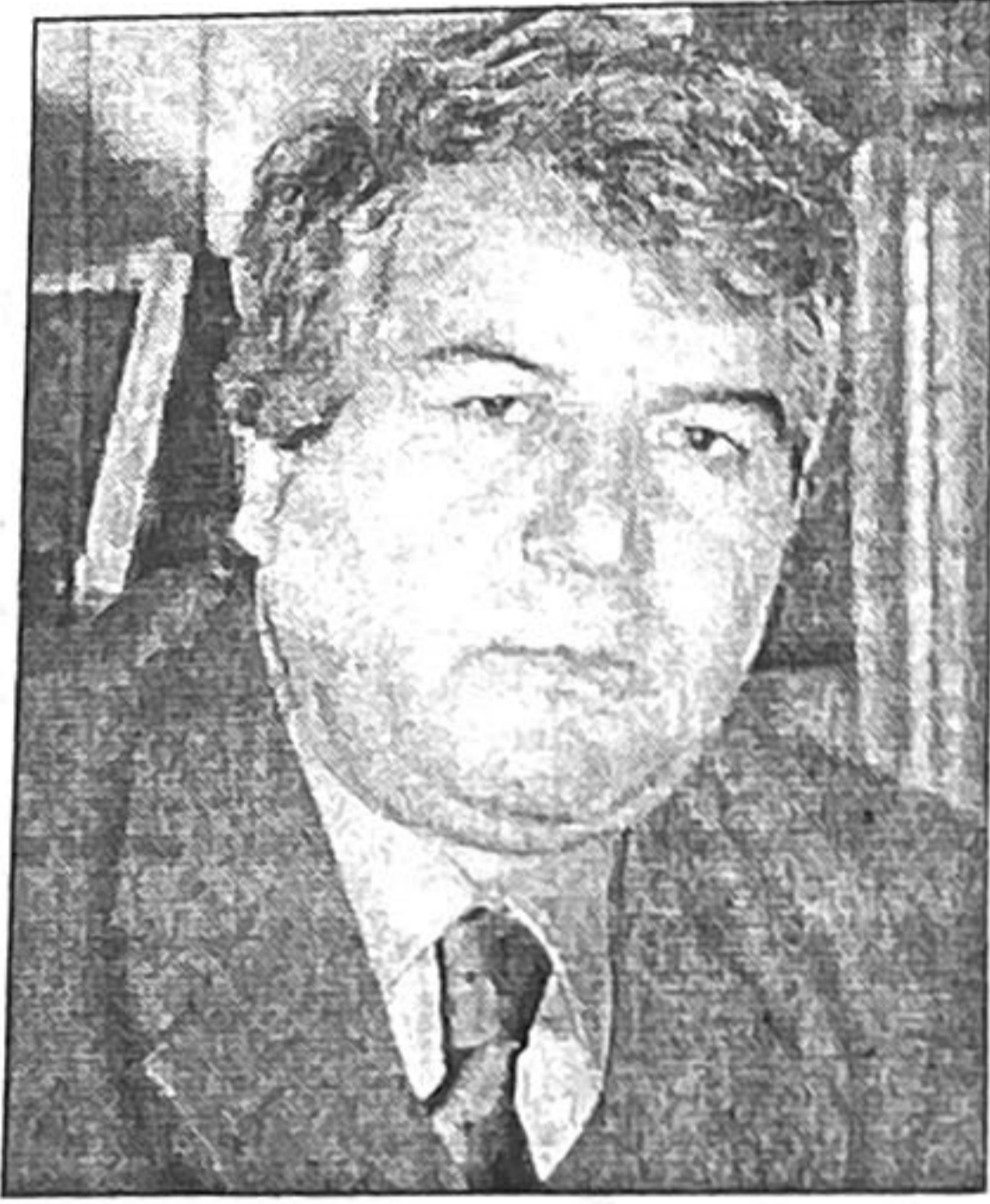
Sabir Rüstəmxanlı, VHP sədri, millət vəkili

"Hələ gəncdir", "böyüyəndə ağı başına gələr" qınaqları ilə yaşı gəlib qırx beşi haqlayıb. Məncə, bu yaş yazarın xırda mətbuat dedi-qodularından qopub masaya, kağıza bağlanaraq, xəyalında yaşadığı ən mühüm əsərini yazmaq, daşımali olduğu ən ağır yükün altına girmək yaşıdır.