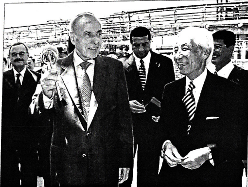
Yayın qızmar bir günü idi — 2001-ci ilin 7 iyulu. Bütün sumqayıtlar həmin günü böyük maraqla, səbrsizliklə gözləyirdilər. Şəhərdə hamı qabaqcadan bilirdi ki, yaxın günlərdə ölkə rəhbəri Heydər Əliyev Sumqayıta gələcək, Edilən-pollietlen zavodunda yeni inşa edilmiş nəhəng, unikal bir enerji qurğusunun — Yaponiyadan ilk əvvəl alınaraq gətirilmiş Buxar-generator kompleksinin açılışında iştirak edəcək.

Bu, Ulu öndərin kimyaçılar şəhərinə 15-ci səfəri idi