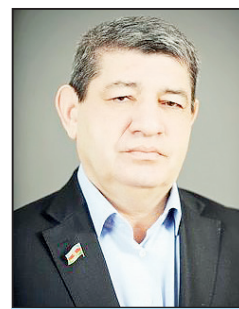
Nizami Cəfərov, akademik

“Xudafərin” və “Qız Qalası” hidroqovşaqlarının və su elektrik stansiyalarının tikilməsinin tarixi əvvəllərdə gedib çıxır, hətta bu proses sovet hökumətinin 60-cı illərində başlamışdı. İranla Azərbaycan Respublikası arasında danışıqlar prosesində bu məsələ yenidən ortaya çıxdı. Bu baxımdan Cəbrayıl bölgəsinin azad