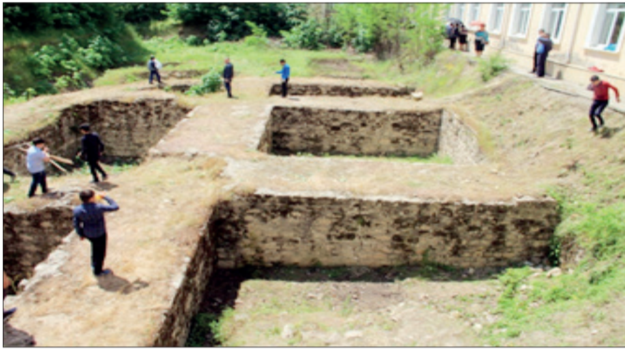
Şamaxı şəhərində qüllə formalı binada aparılan arxeoloji qazıntıların görüntüləri

Hesab edirik ki, indiki halda abidənin 1 nömrəli məktəbin altına düşməyən hissəsində arxeoloji tədqiqatları davam etdirmək, Şamaxının loqosu ola biləcək bu abidəni tam olaraq üzə çıxarmaq, onun dərinindən və hərtərəfli öyrənilməsi işini bir an belə nə ləngitmək, nə də təxirə salmaq olar. Çünki bu tikili hələlik Şamaxının uzaq keçmişindən bu günə boylan ən möhtəşəm abidəsidir.