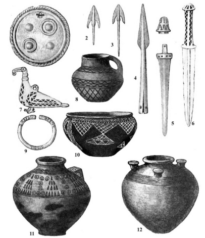
Xocalı-Gədəbəy mədəniyyəti nümunələri: Xocalı-Gədəbəy mədəniyyəti: 1 - qulaqüstü asma bəzək; 2, 3 - ox ucluqları; 4 - niza ucu; 5, 6 - xuncurlar; 7 - asma bəzək; 9 - bilsəzik; 8, 10-12 - sassa qablar

biz mütəxəssislər üçün də bəzən problemə çevrilir. Məsələn, bir il öncə institutumuzun arxeoloji fondunda araşdırma apararkən mən 1981-1983-cü illərdə tədqiqində bilavasitə iştirakçı olduğum Uzunboylar və Qırlartəpə arxeoloji ekspedisiyalarının materiallarının xeyli qismini orada tapa bilmədim. Arayış üçün bildirim ki, Alban dövrünün yadigarı olan həmin abidələrdən aşkar etdiyimiz çoxsaylı silah nümunələri, bəzək əşyaları və keramika nümunələri ilkin olaraq öyrənildikdən sonra səliqə ilə qutulara yığılaraq AMEA-nın arxeoloji fonduna təhvil verilmişdi. Hansı ki, indi həmin qutulardakı materialların xeyli qisminin kimə verildiyi və harada olduğu heç kəsə məlum deyil. Digər arxeoloji ekspedisiyaların materialları barədə də eyni sözləri de-