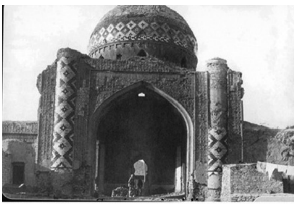
Sərdar (Abbas Mirza) məscidi. 1896.

Göy məscid dünyada Azərbaycan məscidi kimi tanınmalıdır