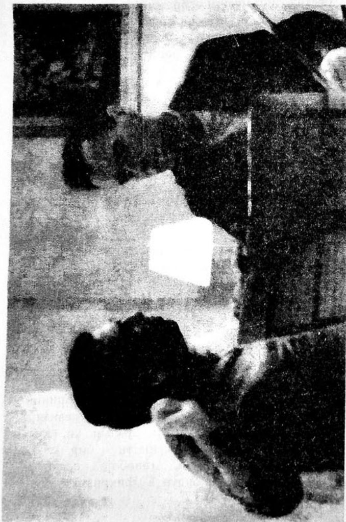
Гара Гарајев вә Леонид Коган

дүрүстләшдирилмәјә еһтијачы вардыр. Мән 10 илдән артыг мүддәтдә Москвада јашамышам вә дөфәләрлә ән бөјүк тәнтәнәләрдә, мәсәлән, Тушино тәјјарә мејданында кечирилән авиасија бајрамларында Гара Гарајевин мәшһур марынын сәсләндирилмәсинин шаһиди олмушам.