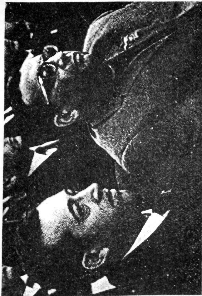
Таһир Салаһов вә Гара Гарајев. 1966

тинин гәрары илә 1975-чи илдә докторлуг диссертасијасыны баша чатдырмаг үчүн Москваја бир нечә ил мүддәтинә е'зам едилдим. Һәмим илләрдә Азәрбајчан мәдәнијјәти вә инчәсәнәти илә әлагәдар олараг Москвада кечирилән тәдбирләрин демәк олар ки, әксәријјәтиндә иштирак етмишәм. Белә тәдбирләр дедиклә, мән көркәмли шаиримиз Сәмәд Вурғунун 29 нојабр 1976-чи илдә ССРИ Дөвләт Академик Бөјүк театрында кечирилән 70 иллик јубилејини, өлмәз бәстәкарымыз Үзејир Һачыбәјовун 28 нојабр 1975-чи илдә Иттифаглар Евинин Сүтунлу салонунда 90 јашынын гејд едилмәси илә әлагәдар олан тәдбирләри вә с. нәзәрдә тутурам.