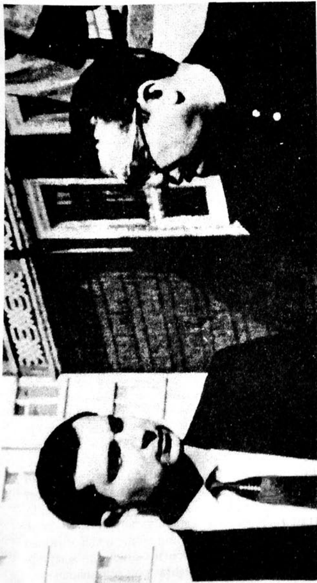
Гара Гарајев və бəстəкəр Агшин Өлизэдə. 1967.

Мə'лумдур ки, һәр бир мұәллимин ән күчлү кејфијјетләриндән бири онун бачарылыы, һәтта мұәллимини үстәләјә билән тәләбәләр јетишдирмәсидир. Бу сահәдә Үзејир бәјин фәалијјәти ән хош сөзләрә вә јүксәк гижмәтә лајигдир. Онун мусиги сահәсиндәки јарадычылыг уғурлары гырылмаз телләрлә Азәрбајчан халгы илә бағлыдыр. Бөјүк Низаминин сөзләринә јазылмыш «Севкили чанан» вә «Сәнсиз» романсларындан тутмуш, «Короғлу» операсына гәдәр јаздыгы бүтүн әсәрләриндә о, өз доғма халгыны тәрәннүм етмишдир. Она көрә дә Үзејир һачыбәјов бизим милли фәхримиздир, Азәрбајчан мусигисинин классикидир.