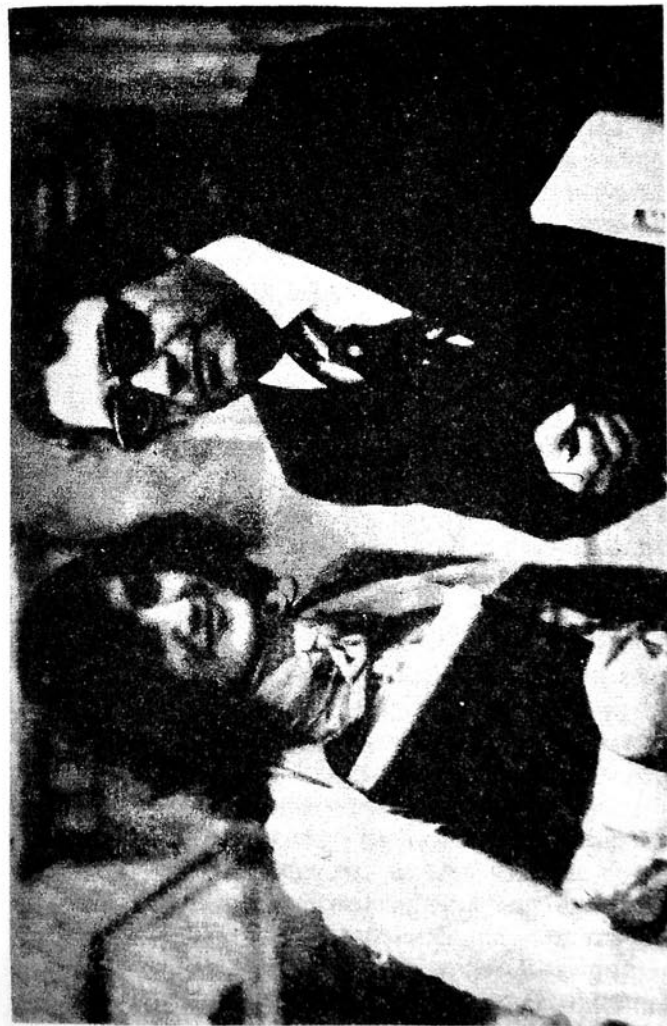
Гара Гарајев вә бәстәкар Фирәнкиз Әлизаде. Пезаро. 1976.

төлөблөр дежил, төшөккүр газанмаг, алгышланмаг вә бу јолла да мөгсәдә чатмаг чәкилир. Мәсәлән, актјор сәһнәдә шит-шит һәрәкәтләр етмәклә, јүнкүл мәзмунлу интермедиялар данышмагла бә’зи тамашачылары “күлдүрүр”, өзү исә “таныныр” вә сонра да халг артисти адыны алыр. Тәснифләри мүстәгил маһны кими сәсләндирән вә беләликлә дә “өз маһнысыны” дилләр өзбәри едән бәстәкарлара да раст кәлмәк олур. Алим әлдә етдији кичик бир елми нәтичәни чохла јерләрдә чап етдирир, бу јолла мәгаләләринин сајыны артырыр вә беләликлә дә, јүксәк елми вә фәхри адлар алмага мүвәффәг олур. Идманда да белә мејлләрә тәсадүф едилер. Јә’гин ки, әсл идман јарышы наминә мејданчаја чыхмаг әвәзинә, азаркешин рәғбәтини газанмаг вә өз “артистизми” илә онларын дигәтини чәлб етмәји гаршысына мөгсәд гојан футболчулар да аз дејилдир. Әлбәттә, белә һаллар чәмијјәтин инкишафына мәнфи тә’сир кәстәрир, динләјичиләр вә тамашачыларын зөвгүнү корлајыр вә онларда белә јабанчы сәпкидә јарадылмыш әсәрләрә үстүнлүк вермәк һиссләрини тәрбијә едир. Бу ишдә радио вә телевизијанын “хидмәтләри” исә хүсуси гејд едилмәлидир. Мәсәлән, әввәлләр гүсурлары чох ајдын көрүнән вә кениш динләјичи күтләси тәрәфиндән севилмәјән мусиги әсәрләрини радио вә телевизија васитәсилә тез-тез сәсләндирмәклә, адамлары һәмин мусигијә “алышдырыр” вә