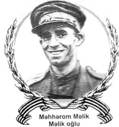
Məhərom Məlik Məlik oğlu Polkovnik