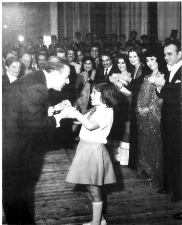
Ulu öndər istedadlı gəncləri xalqımızın xoş gələcəyi hesab edirdi

O, 1969-cu ildə Azərbaycan Respublikasının rəhbərliyinə birinci gəlişi ilə iqtisadiyyatımıza elmi idarəetmə üsulunu gətirdi. Bu da çox keçmədən maddi, sosial irəliləyişə və məntiqi davam kimi, mədəniyyət sahəsində böyük yüksəlişə səbəb oldu.