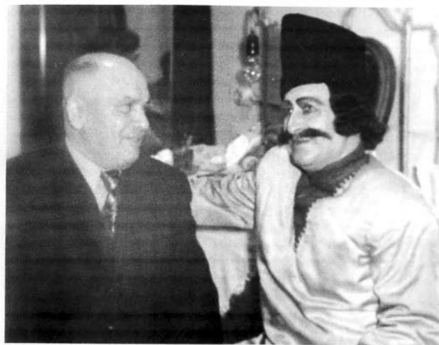
Opera səhnəmizin əbədi Koroğlusu

Bülbül Azərbaycan milli musiqi alətlərinin orijinallığının qorunmasında əvəzsiz xidmət göstərmişdir. "Tar məktəbi", "Kamança məktəbi", "Balaban məktəbi" tədris ədəbiyyatlarının çapa hazırlanmasında və görkəmli xanəndə Cabbar Qaryağdıoğlunun 300 mahnı və təsnifinin fonovalikə yazılmasında Bülbülün böyük xidmətləri olmuşdur.