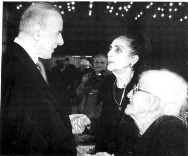
Ulu öndər Heydər Əliyev Gülxar Həsənovanın sənətini yüksək qiymətləndirirdi

Xalq artisti, bəstəkar Şəfiqə Axundova: «Gülxar Həsənova dedikdə mən, qürur hissi duyuram. Bir axşam Üzeyir Hacıbəyovun «Leyli və Məcnun» tamaşası gedirdi. Mən süflyor budkasında oturmuşdum, tamaşa başlandı. Başımı qaldıranda Leyli rolunda gözəl bir qadın gördüm, əsl Leyli – ucaboy, alagöz, son dərəcə üzü məlahətli, cazibədar, gözəl səslə, gözəl avazlı. Gülxar Həsənova idi. O, bütün rolları gözəl oynayırdı. Elə bu səbəbdən də xalqın hafizəsində Ərəbzəngi kimi qaldı».