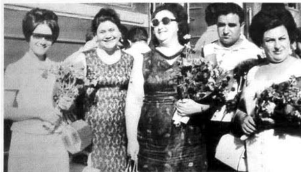
«Ağ çiçəyim» mahnısının ifaçısı çiçəklərin əhatəsində