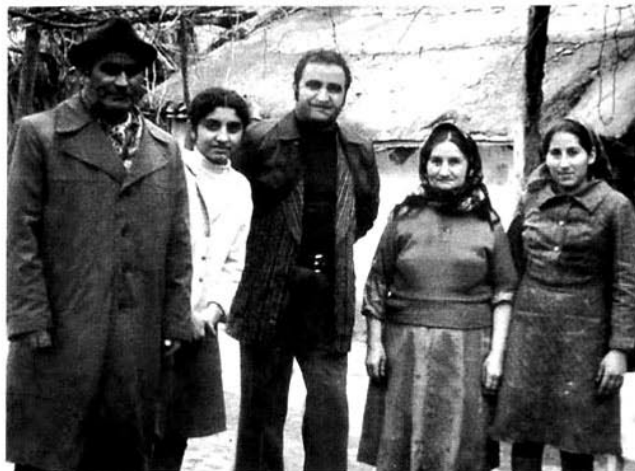
Görkəmli xanəndə Zərdab rayonunda

Xalqını dünyalar qədər sevən sənətkar xarici ölkələrlə yanaşı, tez-tez respublikamızın regionlarına qastrol səfərlərinə çıxır, zəhmətkeşlər qarşısında konsertlər verir.