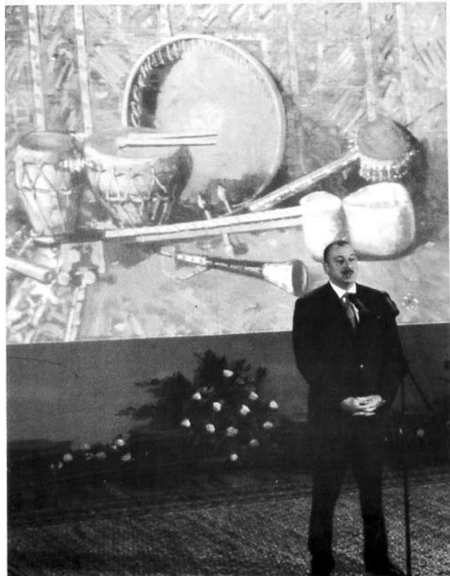
Prezidentimiz muğam sənətinə daim qayğı göstərir

Son illər iqtisadiyyatımızın yüksəlişi öz xoş əks-sədasını mənəvi sahələrdə də tapmışdır. Ulu öndərin ideyalarına sadıq qalan, onun arzularının gerçəkləşməsinə ləyaqətlə davam etdirən Azərbaycan rəhbərliyi günbəgün artan maddi imkanlarımızı dövlətin qüdrətlənməsinə, istehsal sahələrinin genişlənməsinə, əhalinin sosial vəziyyətinin yaxşılaşmasına, böyük abadlıq işlərinin aparılmasına yönəltməklə yanaşı, təhsilimizin, elmimizin, idmanımızın, mədəniyyət və incəsənətimizin inkişafına yetərincə dəstək verir.