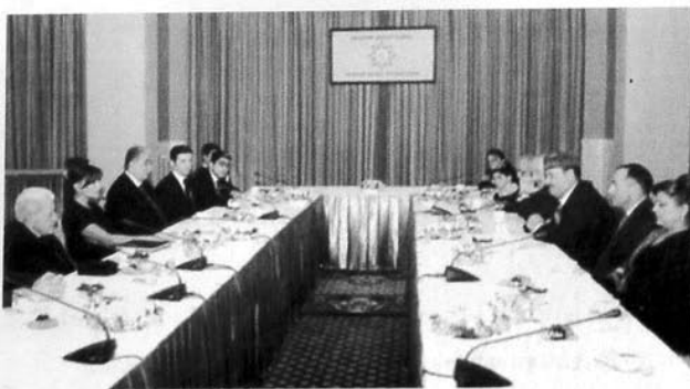
Heydər Əliyev Fondu muğamatımızın keşiyindədir

Xalqın hissiyatına janrlar arasında ən yaxını muğamat olduğundan, təbiidir ki, müstəqillik dövründə ilk növbədə məhz o dirçəliş tapdı, yüksəliş əldə etdi. Prezident İlham Əliyevin qayğısı, Heydər Əliyev Fondunun prezidenti Mehriban xanım Əliyevanın öz fəaliyyətində bu sahəyə böyük önəm verməsi az bir vaxtda muğam sənətimizi layiqli mərtəbəsinə qaldırdı.