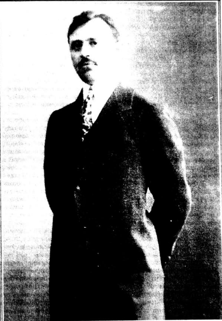
Үзејир бəј һачыбəјов (1913).