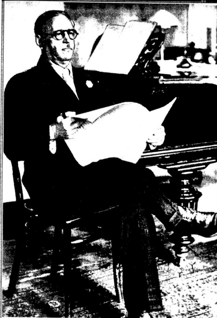
Үзејир бәј һачыбәјов мүталиә заманы (1939).