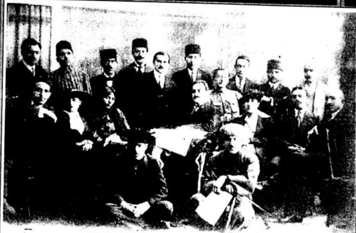
1918-1920-чи илләр «Азәрбајчан» гәзетинин коллективи (1919).

тохунурду. Мәсәлән, режиссор иши, актјор ојуну вә онун јозуму, кейим мәсәләләри вә с. онун мүрачидәт етдији мөвзулар иди. Азәрбајчан сәһнәсинә гадын кәтирилмәси уғрунда Ү. Начыбәјов даим мүбаризә апарырды. О, өз публисистик јазыларында дәнә-дәнә гејд едирди ки, туман кејинән кишиләр мәнә лазым дејил! Гадын ролларыны мүтләг зәнәнләр ојнамалыдырлар.