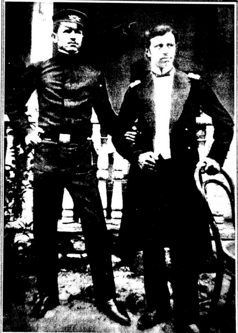
Үзејир бәј вә Чейһун бәј һачыбәјов гардашлары (1904).