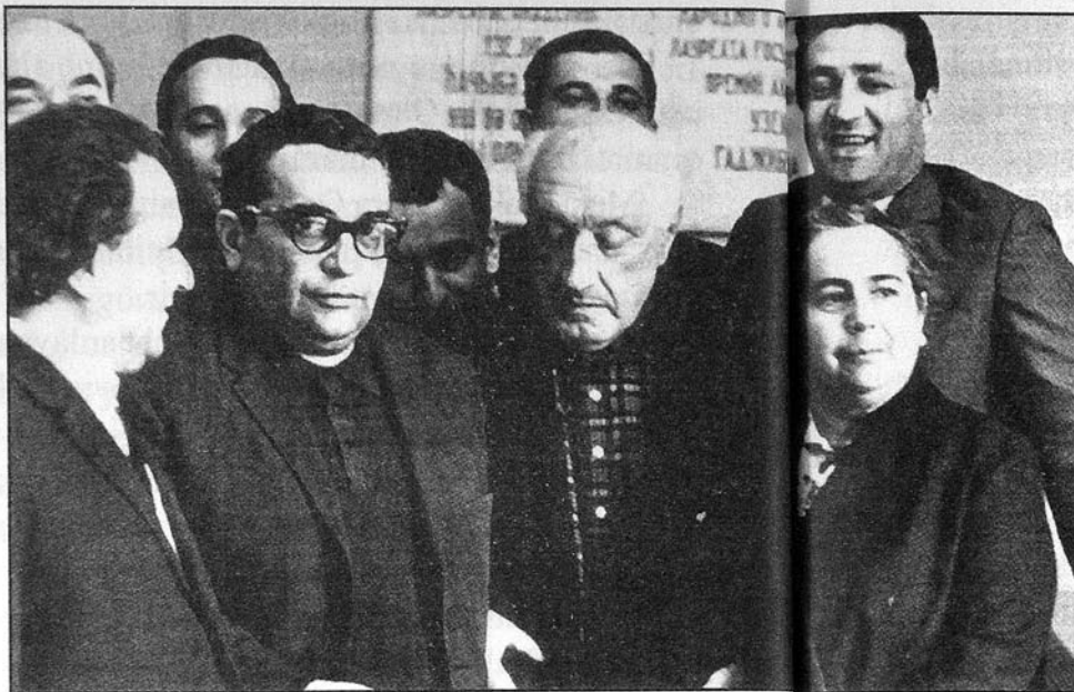
Qara Qarayev bəstəkarlar və musiqiçilər arasında