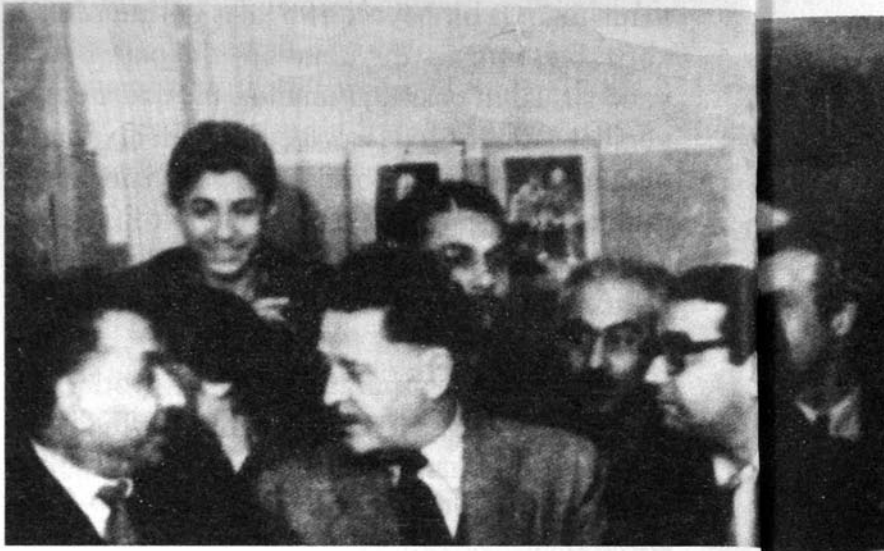
Nazim Hikmet və Qara Qarayev aktyorlarla

Axundov adına Azərbaycan Milli Kitəbxanası