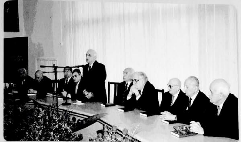
Görkəmli yazıçı, alim və pedaqoq Mir Cəlal Paşayevin "Azərbaycanda ədəbi məktəblər" kitabının təqdimat mərasimi.