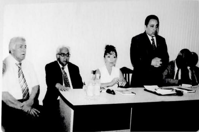
Bakı Dövlət Universitetində