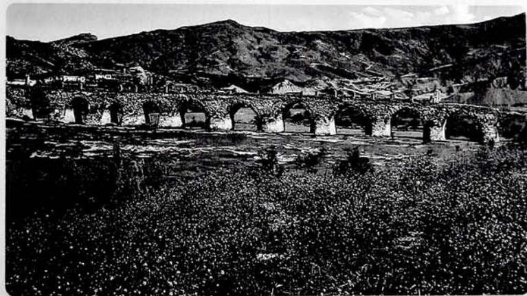
Təbriz yaxınlığındakı Əndəbil kəndindən Gəncəyə gedən yol. Xudafərin körpüsü.