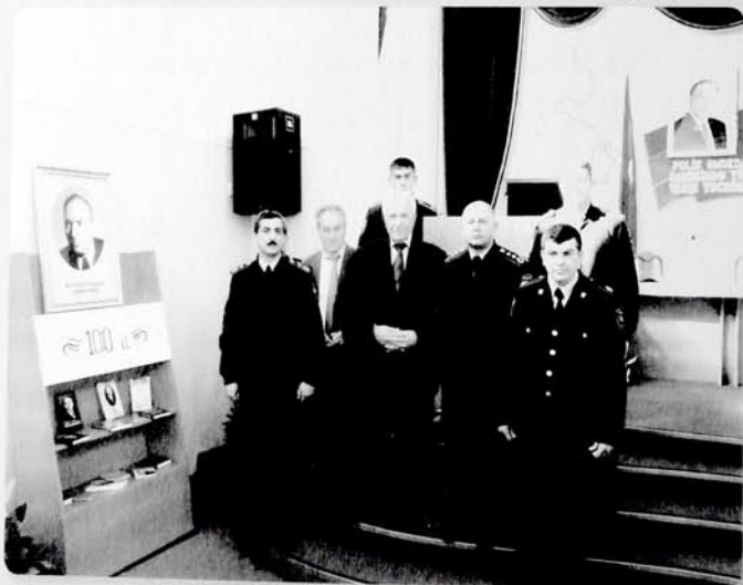
Mir Cəlal Paşayevin 100 illik yubileyində. Polis Akademiyası.