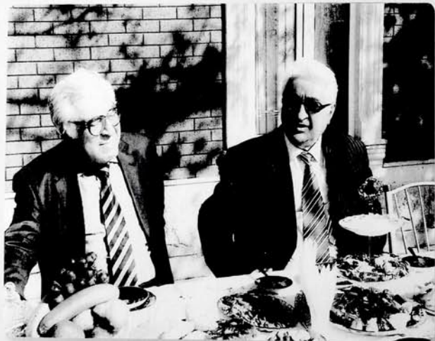
Akademik Arif Paşayev və Xalq yazıçısı Anar. Gəncə, 2008-ci il.