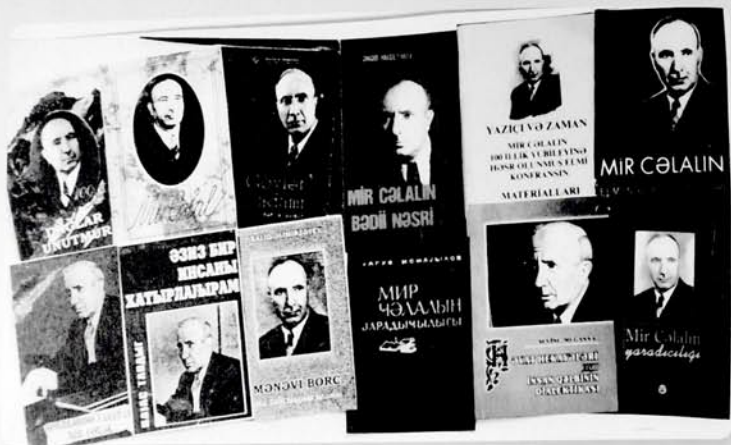
Böyük yazıçı, alim, pədaqoqun həyatına, ədəbi, elmi fəaliyyətinə həsr olunmuş kitablar...