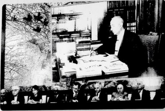
Mir Cəlalın 100 illik yubileyinə həsr olunmuş təntənəli yığıncaq. Gəncə. Aprel, 2008-ci il.