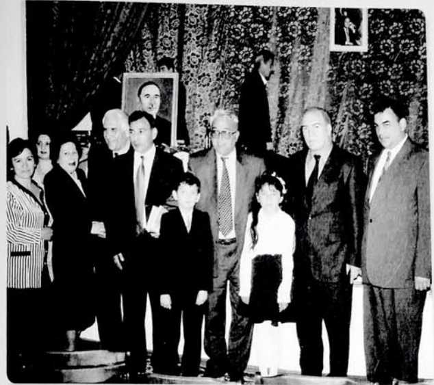
Gəncə, Mir Cəlalin yubiley tədbiri.