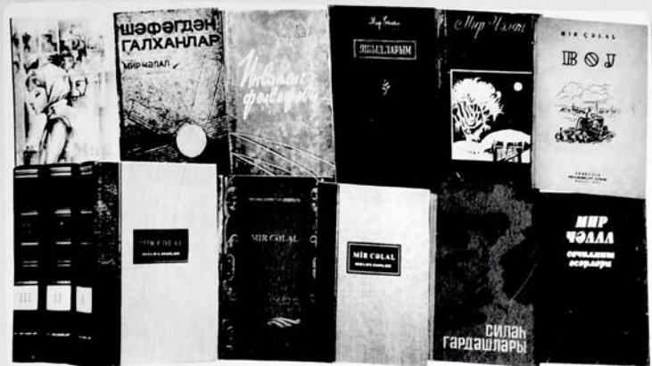
Mir Cəlal həmişəyaşar bədii əsərləri ilə zamanla ayaqlaşır.