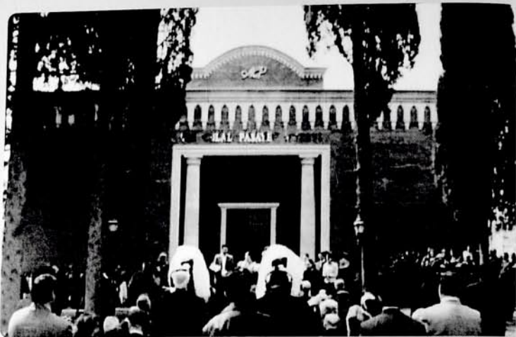
Mir Cəlalin ev muzeyinin açılışında. Gəncə, aprel, 2008-ci il.

Mir Cəlal Paşayevin Gəncədəki ev muzeyi şəhərin qədim, sakit və hay-küydən uzaq bir məhəlləsində – Bayan küçəsində yerləşir. Qırmızı kərpicdən tikilmiş birmərtəbəli yaraşığıl muzey binası qarşısında sərv ağacları ucalır. Mir Cəlal gənlik dövründə Bayan küçəsində yaşayıb. Muzey görkəmli ədibin 100 illik yubileyi ərəfəsində tikilib istifadəyə verilmişdir.