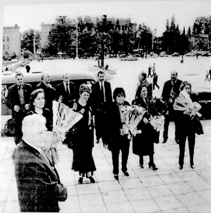
Mir Cəlalin ev muzeyinin açılışı zamanı Gəncəyə gələn nümayəndələr. 2008-ci il.