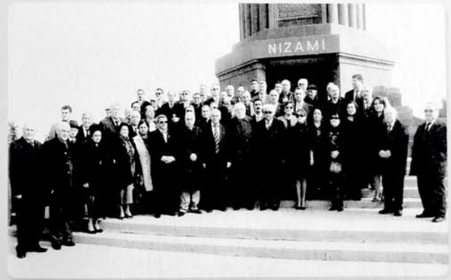
Mir Cəlalin yubiley tədbirlərinin iştirakçıları. Gəncə, Nizami Məqbərəsinin önündə. Aprel, 2008-ci il.