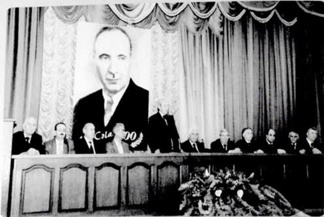
Azərbaycan Dövlət Pedaqoji Universitetində görkəmli alim, nasir, böyük müəllim Mir Cəlal Paşayevin anadan olmasının 100 illik yubileyinə həsr olunmuş tədbir