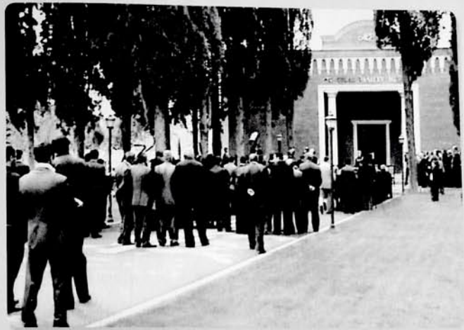
Mir Cəlalin ev muzeyinin açılışında. Gəncə, aprel 2008-ci il.

Mir Cəlal Paşayevin Gəncədəki ev muzeyi şəhərin qədim, sakit və hay-küydən uzaq bir məhəlləsində – Bayan küçəsində yerləşir. Qırmızı kərpicdən tikilmiş birmərtəbəli yaraşığıl muzey binası qarşısında sərv ağacları ucalır. Mir Cəlal gənlik dövründə Bayan küçəsində yaşayıb. Muzey görkəmli ədibin 100 illik yubileyi ərəfəsində tikilib istifadəyə verilmişdir.