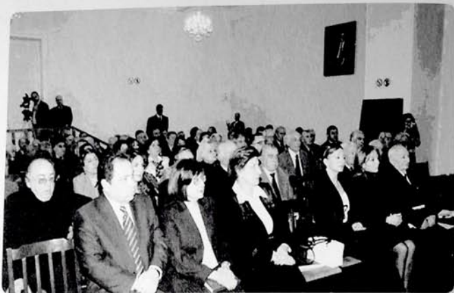
Azərbaycan Milli Elmlər Akademiyasında Mir Cəlalın yubiley tədbiri.