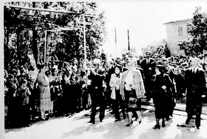
Yubiley tədbirləri. Gəncə. Aprel, 2008-ci il.