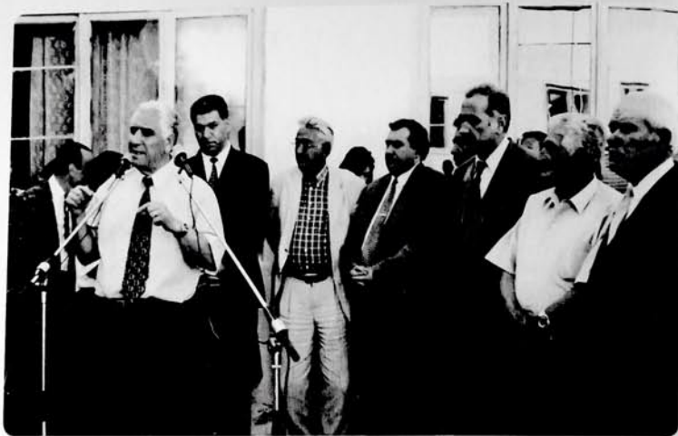
Şəmkirdə Mir Cəlal adına küçənin açılış zamanı.

Müharibə Mir Cəlalin "qəlbində alovlu qəzəb" oyatmışdı. O, müharibə dəhşətlərini gözüylə görə yazıqlarımızdandır. Əlinə silah götürüb bilavasitə vuruşmasa da, gedib aylarla müharibə cəbhəsində qalmış, azərbaycanlı döyüşçülər qarşısında bir sıra dəyərli mühazirələr oxumuşdur.