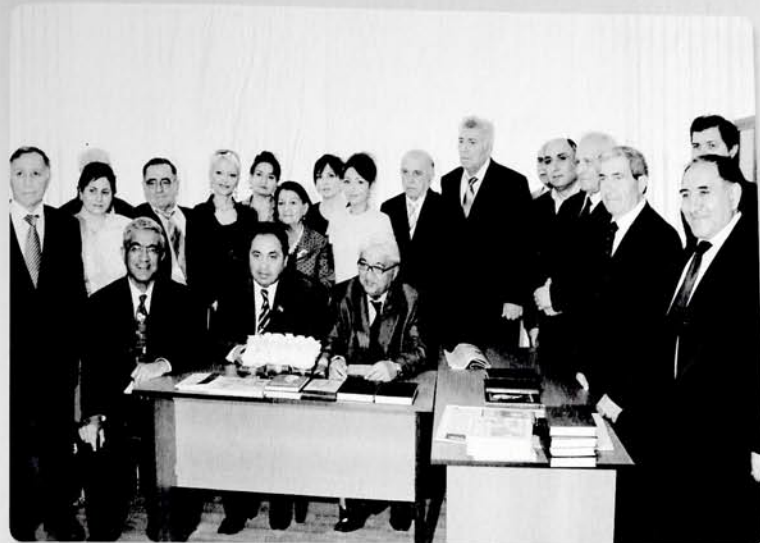
Bakı Dövlət Universitetində yubiley tədbiri

Aprelin 26-da Bakı Dövlət Universitetində Azərbaycan ədəbiyyatının və elminin inkişafında böyük xidmətləri olan görkəmli yazıçı, alim və pedaqoq, professor Mir Cəlal Paşayev vaxtilə rəhbərlik etdiyi "Azərbaycan ədəbiyyatı tarixi" kafedrasının önündə bələyefinin açılışı olmuşdur.