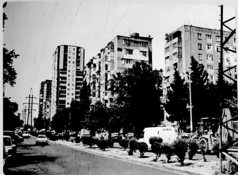
Bakı şəhəri, Mir Cəlal küçəsi.

...Xalqımız öz sənətkar, alim oğlunun xatirəsini əziz tutur. Onun yaradıcılığı orta və ali məktəblərdə geniş tədris olunur, əsərləri təkrar-təkrar nəşr edilib gələn nəsillərə çatdırılır.