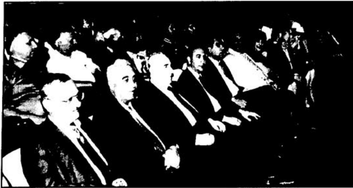
"Koroğlumun Çənlibelə qayıdışı" əsəri göstərilərkən tamaşa salonu həmişə dolu olur