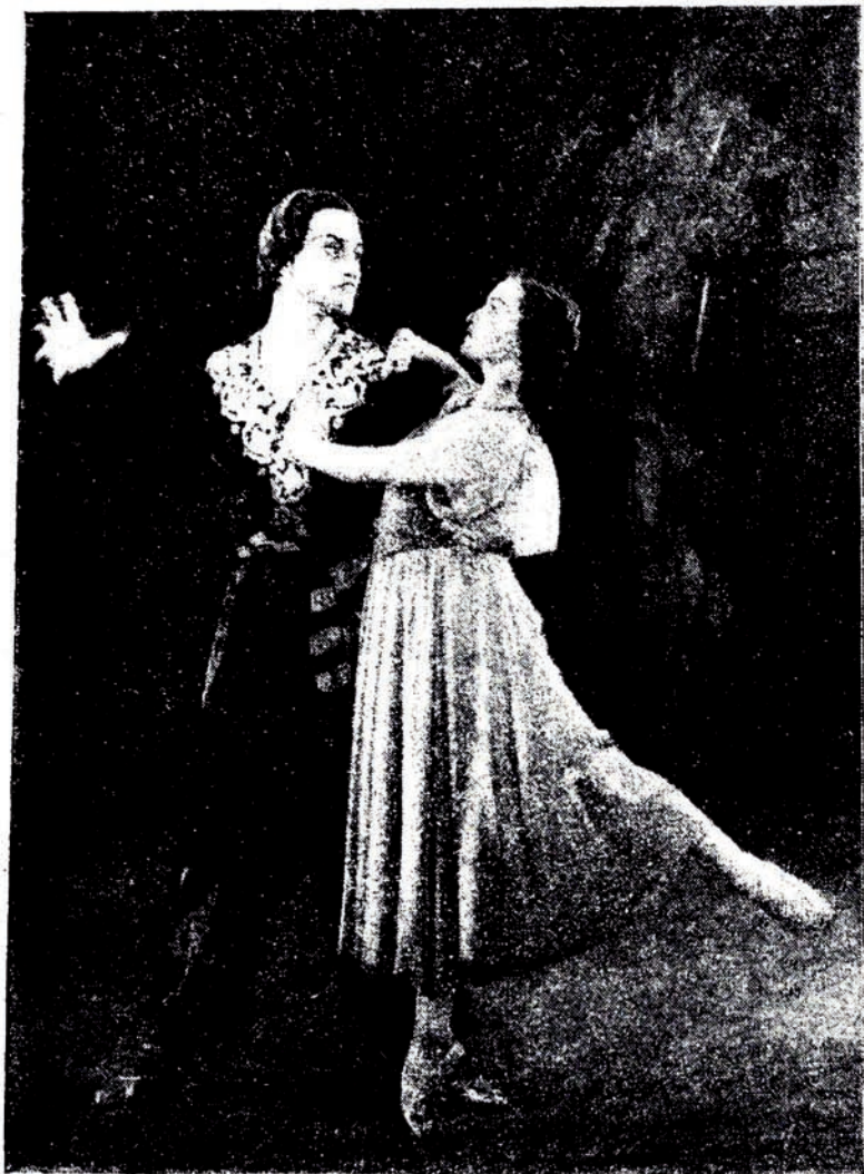
Г. Гарајевни «Једди көзэл» балетинин 7-чи шәклиндән Адажно.

М. Ф. Ахундов адына Азәрбајжан Дөвләт Опера вә Балет театры.