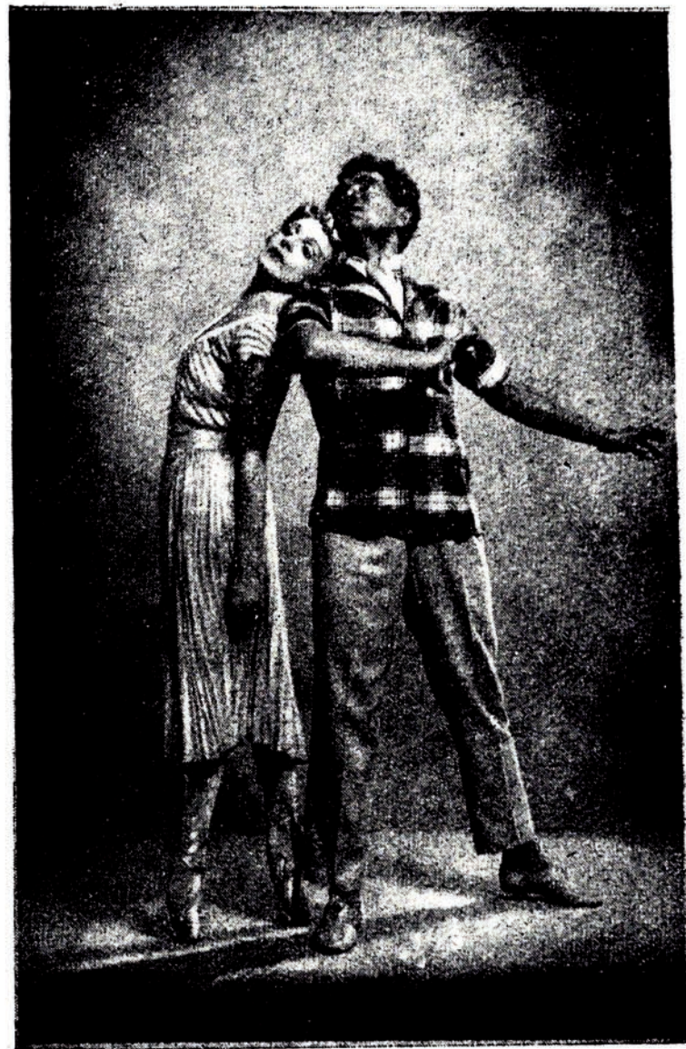
«Илдырымлы јолларла» балетиндән сәһнә

Бәстәкарын өз мусигисиндә парлаг сурәтдә ачыб көстәрдикләринин бир чохуну Ј. Слонимски өз либретто-сунда нәзәрә алмышдыр. Ссенари, зәнкин конфликт хәтләринин мүрәккәб бирләшмәләри чәһәтдән фачиәли хореографија планында јазылмышдыр ки, бу да бөјүк емоционал-психоложи јекунлашдырма үчүн кениш меј-