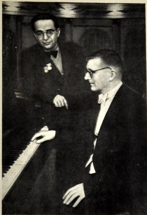
Мәшһур совет бәстәкары Д. Шостакович вә Г. Гарајев.

Бир гәдәрдән сонра Г. Гарајев мусигисинә Орта әср мөвзусу јенидән дахил олур. Сервантесини мәшһур гәһрәманы, шәһрәтли «чәнкавәри» бәстәкарын «Дон Кихот» (1960) симфоник гравүрләриндә јенидән јашамаг һүгүгу газаныр. Бурада романдакы сүжәт ардычылығыны тәхмини олса да ахтармаг дүзкүн дејилдир. Г. Гарајевин Дон Кихотун сәркүзәштләри вә һәјәтиндакы көзәлнимәз дәјишикликләр марагландырмыр. Һәмишә олдугу кими, бәстәкар бунларын арасындан әсас чәһәти — хејрхәһлыг наминә гәһрәманылыг көстәрмәк истәјән вә тәһналыга мәнкум едилән, Орта әср гәјдаларынын әталәт кирдабында һәлак олан инсанын фәдакарлығыны дүјүб-«охуја» билимишдир. Бәстәкар жанр вә композисија штрихләринә көрә фәрг-