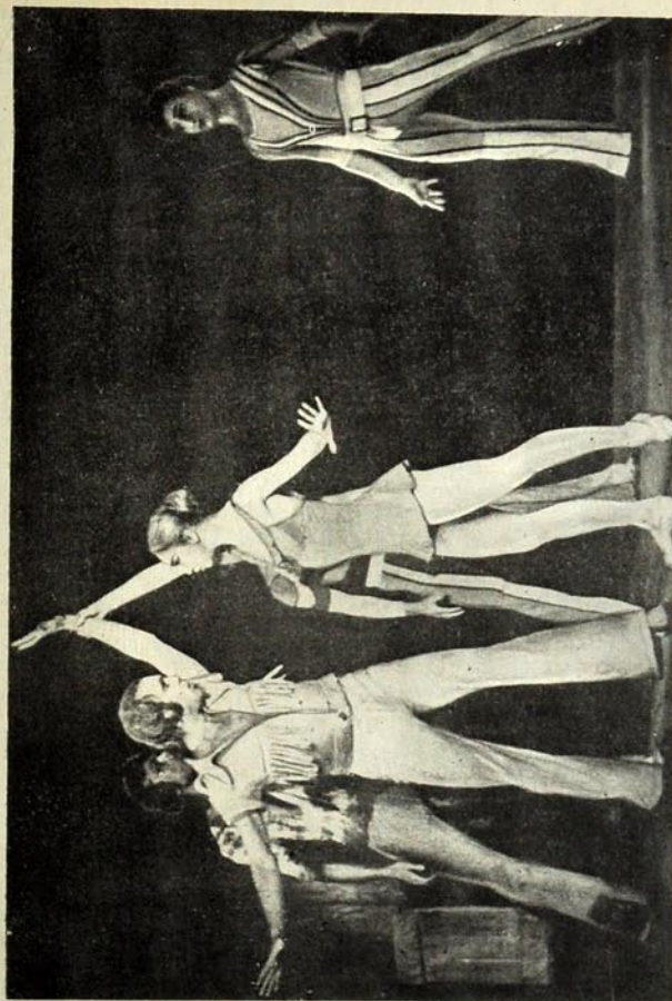
«Идарымагы-јолларла» балетиндән бир сәһна.

Рәгс сүйталары бир чох балетләрдән фәргли олараг әјләндиричи — дивертисмент характери дашымыр. Онлар һадисәләрә әнкинди, үмуми