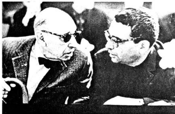
Qara Qarayev İ.Stravinski ilə Кара Караев и И.Стравинский