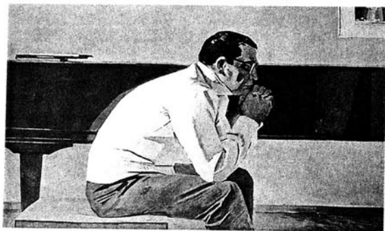
Qara Qarayev (rəssamı T.Salahovdur) Кара Караев (художник Т.Салахов)