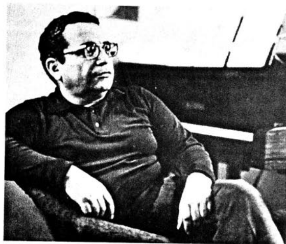
Qara Qarayev Кара Караев