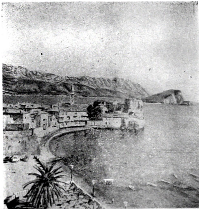
Адриатик дәнизи саһилиндә Видва шәһәрчији.