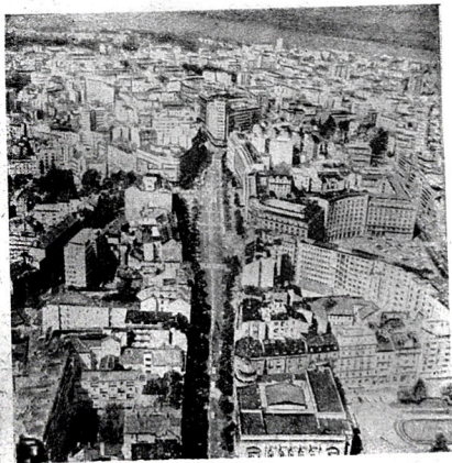
Белград шәһәринин мәркәзи күчәләриндән бири.

Пәнчәрәләримиз Белградын мәркәзи күчәсинә чыхырды. Машыналарын сәси, өзү дә һәрәси бир чүр мело-