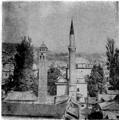
Сарајево шәһәрһиндән бир көрүнүш.