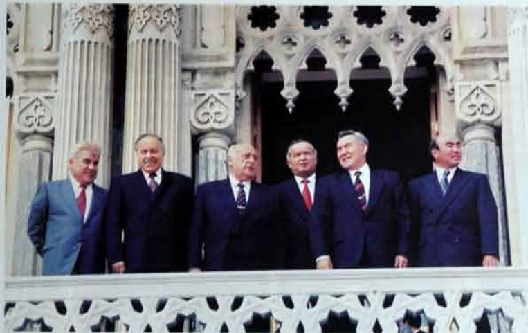
Heydər Əliyev Qərbdə və Rusiyada nə qədər sevidilsə, Türki dünyasında da bir o qədər sevidilər.

Jelyu JELEV, Bolqarıstan Respublikasının sabiq prezidenti