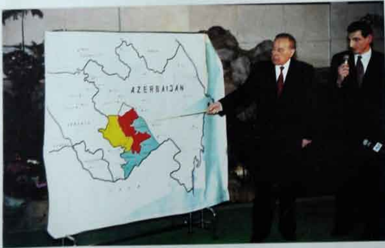
Heydər Əliyev Azərbaycanı bütün dünyaya tanıtdı.

aradan götürmək üçün cəhdlərə başladılar. Bu eür nadanlıqdan möyus olan möhtərəm Heydər Əliyev Naxçıvana qayıdaraq son dəərə ağır günlərini yaşayan muxtar respublikanın əhalisinə arxa və kömək durdu. Beləliklə, həyatın ən çətin dövrünü yaşamaqla hər şey yenidən başlamalı oldu. Yalnız iradəsi poladdan, özmi və qətiyyəti granitdən yığılmışlar belə çətinliyə və məhrumiyətlərə dözə bilərdilər. Həmin dövr bütövlükdə Azərbaycan xalqı üçün də faciəli və fəlakətli keçirdi. Maymaq, qətiyyətsiz və soriyyətli adamların respublikaya başçılıq etməsi, AXC – Müsavat cütlüyünün naşı və təcrübəsiz iqtidarı dövründə xaos, anarxiya və qanunsuzluğun baş alıb gətməsi, arasıksizlik hakimiyyət davası nəticəsində Ermənistan – Azərbaycan müharibəsində baş verən acınacaqlı məğlubiyyət və xaricdən dəstəklənən separatçı qüvvələrin Azərbaycanı kiçik xanlıqlara parçalama cəhdləri ölkəni ləbə ləbə fəlakət həddinə çatdırmışdı. Ümidsiz vəziyyətə düşən insanlar yeməyə çörək belə tapmırdılar. Şəxsi mənafeqlərini güdən «boy»lər isə çörək adı ilə xalqa jmx yedizdirirdilər. Həmi çox gözəl anlayırdı ki, ölkəni bu vəziyyətdən yalnız Heydər Əliyev xəkasi qurtarmağa qadirdir. Odur ki, bütün nəsərlər Naxçıvana çevrildi, xalq özünün şevimli və sənəmiş oğlunu yenidən respublika rəhbərliyinə dəvət etdi. Heydər Əliyevin qayıdışı ilə Azərbaycan dövləti də, kövrək müstəqilliyimiz də fəlakətlər girdabından xilas edildi.