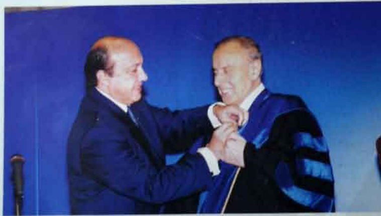
Heydər Əliyev həyatında çox mükafatlar alıb. Bu şəkildə onlardan birini Rusiyanın xarici işlər naziri İqor İvanov təqdim edir. Amma Heydər Əliyev üçün ən böyük mükafat xalqın sevgisidir, bu mükafatı qazanmaq və onu qoruyub saxlamağı bacarmaq hər siyasətçiyə nəsib olmur. Heydər Əliyev isə buna nail olmuşdur.