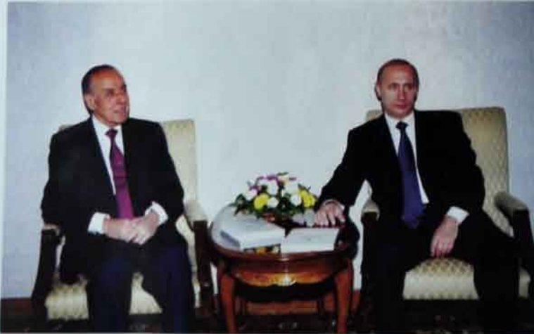
Rusiya ilə Azərbaycanın münasibətləri Vladimir Putinin təbiri ilə desək çox yaxşıdır.