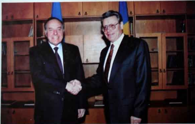
Moldovanın keçmiş prezidenti Petru Luçinski ilə.

Müəyyən bir mərhələdə indi bizim hüquqi varisi olduğumuz Ümumittifaq İnstitutunu ləğv etməyi qərara almışdılar. İnstitutun o vaxtki rəhbərliyi bizə kömək etmək xəbəri ilə Heydər Əliyevə müraciət etdi. Bu fəaliyyət sahəsinə baxan Heydər Əliyev həmişəki kimi müdrik bir qərar qəbul etdi və institutumuzu dinc buraxdılar.