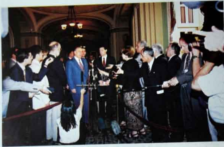
İyul, 1997-ci il. ABŞ Senatının binası.