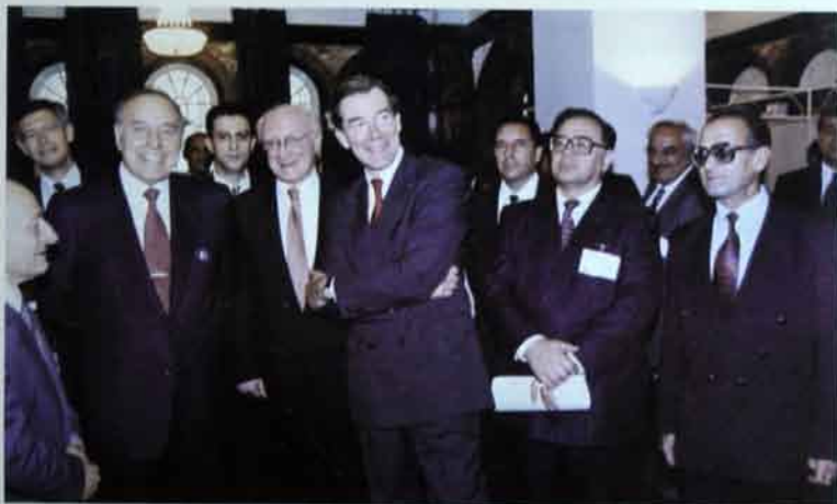
Heydər Əliyev mədəniyyətə, o cümlədən musiqiyə hər zaman diqqətlə yanaşmış. Bu şəkildə dünya şöhrətli siyasətçi ilə, dünya şöhrətli musiqiçi bir yerdədir.