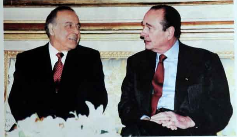
Fransa Avropanın və dünyanın ən aparıcı dövlətlərindəndir. Prezident Heydər Əliyev bunu həmişə nəzərə alıb. Fransa prezidenti Jak Şirakla səmimi görüş.

Vladimir PUTİN, Rusiya Federasiyasının prezidenti