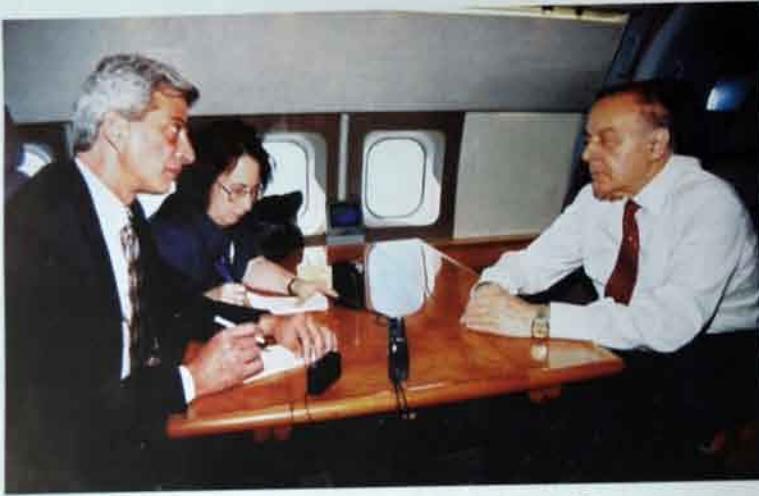
İyul, 1997-ci il. ABS-dan qayıdarkən tayyara da jurnalistlərlə söhbət.