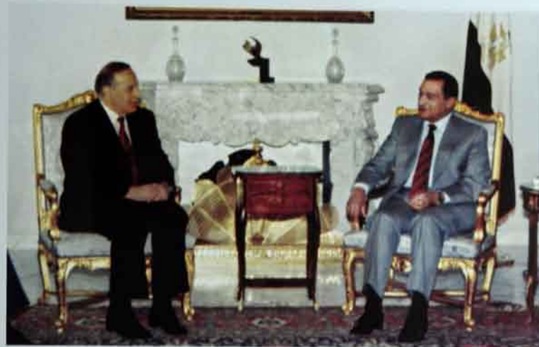
Misir prezidenti Hüsni Mübarakla birlikdə.

Beynəlxalq Kadr Akademiyasının prezidenti