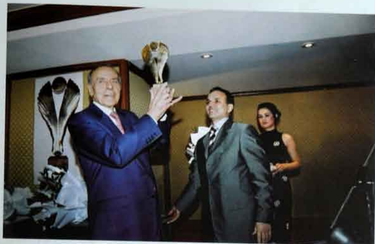
Fevral, 2002-ci il. "Jurnalistlərin dostu" mükafatının təqdimatında marasimində.