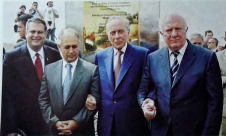
Bakı-Tbilisi-Ceyhanın təməlinin qoyulması regionun tarixində yeni mərhələ olacaqdır. Prezidentlər buna əminliklər.

Bunu deməyə lüzum yoxdur ki, bütün çoxşaxəli fəaliyyəti ərzində Heydər Əliyev haqqında – uzaqgörənliyi, öz siyasətini qurmaq bacarığı, tükənməz iş qabiliyyəti, nəhayət, nadir yaddaşı haqqında, az qala, əfsanələr gözib-dolaşır.