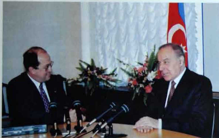
23 aprel 1998-ci il. "Nargiz" TV-yə müsahibə verir.