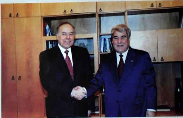
Saparmurad Niyazov Azərbaycan prezidenti Heydər Əliyevlə.