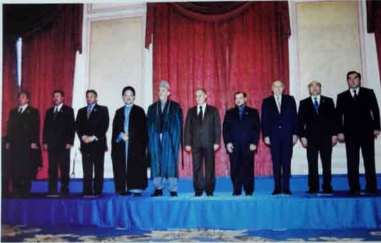
Heydər Əliyev bütün İslam dünyasında böyük siyasi nüfuzə malik bir liderdir.

Hörmətli prezident Heydər Əliyevin rəhbərliyi altında Azərbaycan hər sahədə inkişaf etməkdədir. Beynəlxalq ələmdə özərinə düşən öhdəlikləri yerinə yetirən, müstəqilliyini daim qoru-