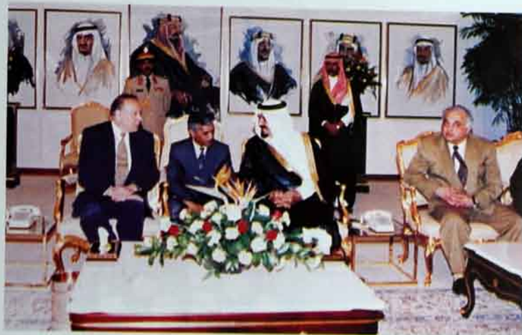
Heydər Əliyev bütün islam dünyasının lideridir və baxdıqımız bu şəkil bunu bir daha təsdiqləyir.

Prezident Heydər Əliyev, həqiqətən, dünya siyasətinin patriarxıdır, onun şəxsiyyəti hür hansı dövlət xadimi üçün parlaq nümunə ola bilər. Hesab edirəm ki, Heydər Əliyevin həyatı öz xalqına, vətəninə fədakarcasına xidmətinin bariz nümunəsidir.