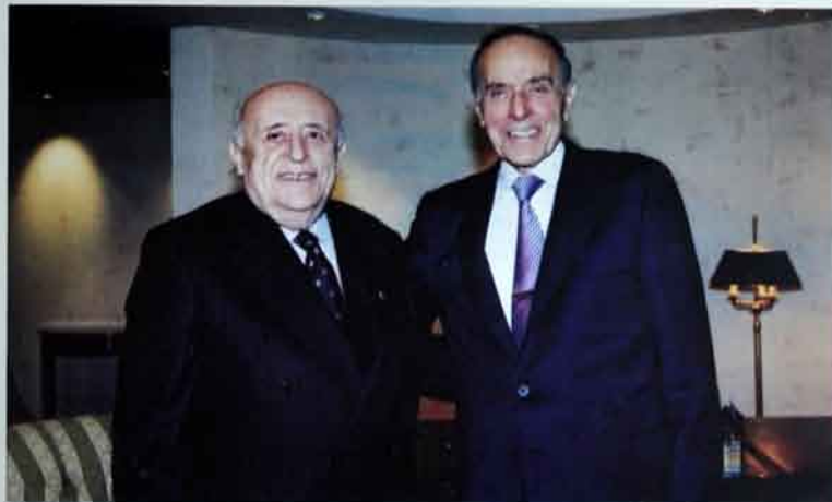
«Bir millət iki dövlət» - qarşılıqlı əlaqələrin zərurətini ifadə edən bu prinsipin əsası prezident Heydər Əliyevlə prezident Süleyman Dəmiral qoymuşlar.

Böyük türk oğlu Heydər Əliyevin Kremldə işləməyə davət olunmasını dünya toqçub və heyratla qarşıladı. Sosializm dövründə üzə «xalqlar dostluğu» və proletar beynəlmilətçiliyi prinsipiinin mövcudluğu tez-tez təkrarlansa da, dövlətdə başqa millətdən olanların SSRİ kimi superdövlətdə rəhbər vəzifəyə irəli çəkilməsi görünməmiş və qeyri-adi hadisə idi. Azərbaycanda işə bunə sevinənlər də çox oldu. Heydər Əliyevin kölgəsini qılınclamağa başlayaraq arxasınca imzasız məktublar toşkil edənələr də tapıldı. Amma çox tezliklə hamı başa düşdü ki, bu güclü şəxsiyyətin respublikadan gəlməsi, sonradan işə düşmənlərin əli ilə böyük siyasətdən uzaqlaşdırılması Azərbaycan xalqının müstəbətli günərlərinin başlanğıcını qoydu. Respublikada vəziyyət aybaq pisləşir, düşmənlər üstümüzə ayaq alırdı. Yenidənqurma adlı oyun, onun ardınca işə Qarabağ problemi meydana atıldı, ölkəmiz uzun və dağdıcı müharibəyə cəlb edildi. Heydər Əliyevin çarəyi ilə böyüyüb ömür sayısında yüksək vəzifə tutanların bir qismi nankor çıxdı. Xalqın ağır vəziyyətdə olduğunu bilib Vətəna qayıdan, ona öz köməyini təklif edən bu müdrik insana öz əlləri ilə tikib qurduğu Bakıda yaşamağa adı bir mənzil belə verənilər. Əksinə, nüfuzundan və ona olan ümumxalq məhəbbətindən qorxaraq taqib etməyə, fiziki cəhətdən