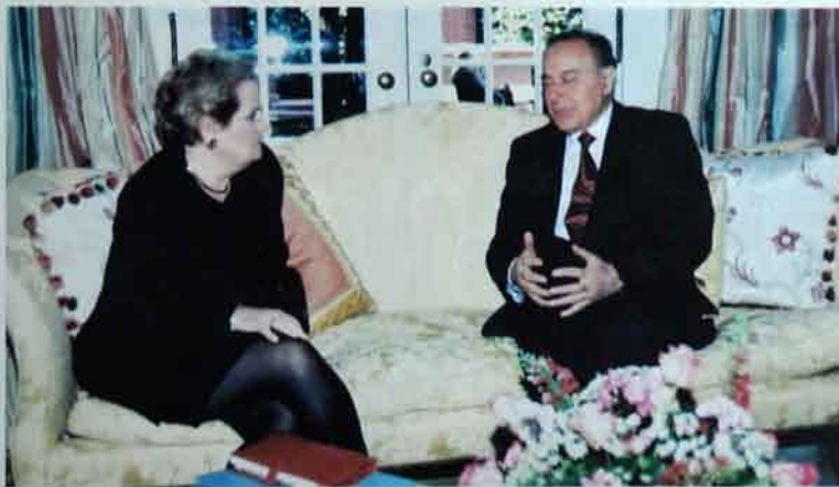
Dünyanı siyasi düzəninin müəyyənliyəsində həlledici rol oynayan ABŞ da Azərbaycanın perspektivinə şübhə etmir. ABŞ-ın sabiq dövlət katibi Madlen Olbrayt Heydər Əliyevlə görüşlərə həmişə böyük diqqətlə yanaşır və buna onun əsası var.