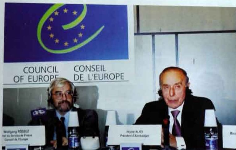
Yanvar, 2001-ci il. Strasburq. Azərbaycan Avropa Şurasına tamhüquqlü üzv qəbul edilir.