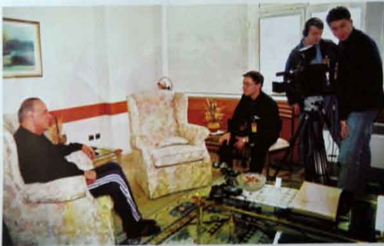
Yanvar, 1999-cü il, Türkiyə.

dernləşdirmək üçün mərkəzi hakimiyyətdən kreditlər ayırmasına nail olmaq lazım idi. Bundan ötrü işü daimi və gərgin diplomatik səylər tələb olunurdu. Lakin bu səylərə Dövlət Plan Komitəsinin yeni rəhbəri Bəybakovun oslon Azərbaycanı canlandıran kömək etmədi.