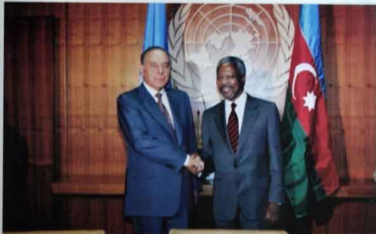
Azərbaycan dünyə birliyinə üzvüdür. BMT-nin baş katibi Kofi Annanla.