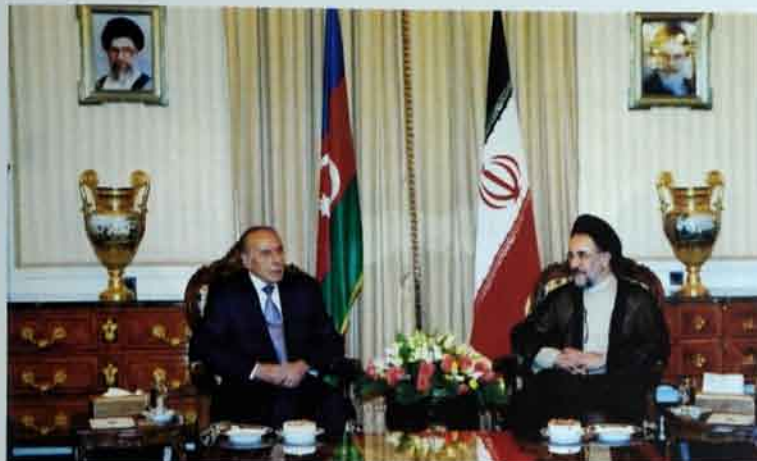
İranda Heydər Əliyevin iradəli, qətiyyətli və böyük siyasətçi olduğuna təkcə prezident Xatami yox, həm də bütün İran vətəndaşları şübhə etmirlər.

Xüsusilə məmnunam ki, bu gün Sizinlə görüşürəm. Çünki Azərbaycan ilə ABŞ arasındakı münasibətlərdə yeni mərhələ açılır.