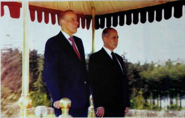
Türkiyə Azərbaycanın dostu və qardaşdır. Prezident İlham Əliyevlə Prezident Rəcəb Tayyib Ərdoğan birlikdə.