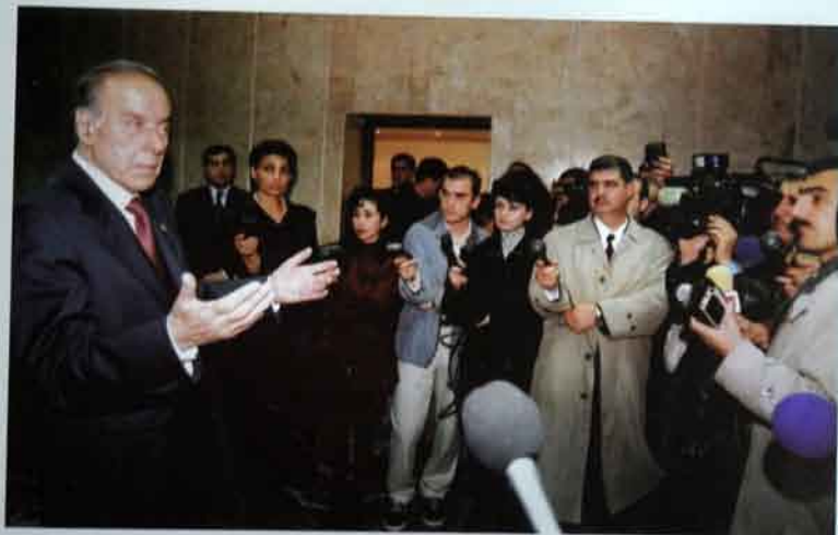
Noyabr, 1999-cü il. Bina hava limanı.