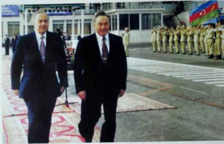
Prezident Nursultan Nazarbayev və prezident Heydər Əliyev.