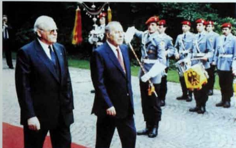
AFR prezidenti Roman Hersoq prezident Heydər Əliyevi qarşılayır.