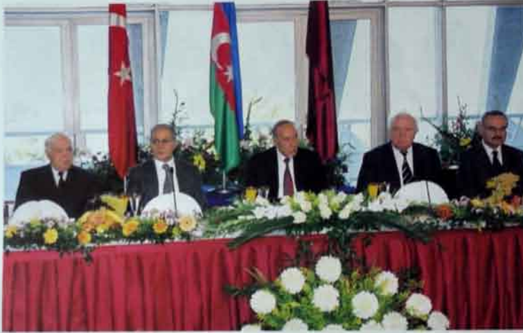
Türkiyə də, Gürcüstan da Azərbaycan üçün önəmli ölkələrdir.