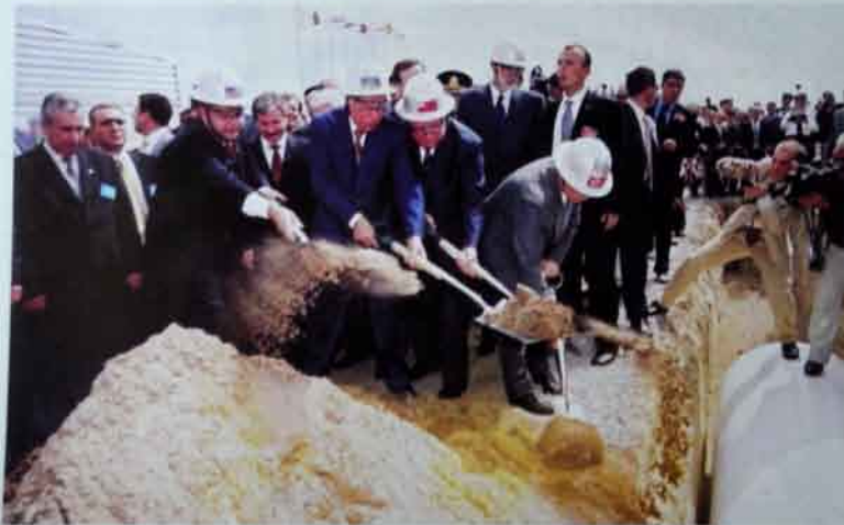
Heydər Əliyev Bakı-Tbilisi-Ceyhanın şəkilsiz və şərtsiz müəllifidir.