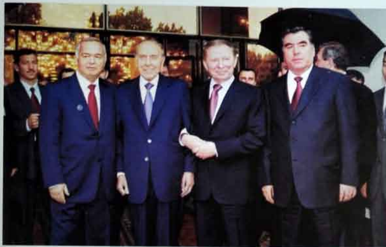
Azərbaycan MDB dövlətlərinin hər biri ilə münasibətlərə həmişə xüsusi önəm vermişdir

Azərbaycanın prezidenti kimi Siz ölkəniz üçün, bölgəniz və dünya üçün çox böyük işlər görürsünüz. Siz Azərbaycana azadlıq, müstəqillik qazandırmısınız. Siz müstəqil Azərbaycan Respublikasını dünyaya tanıtdırdınız. Azərbaycan xalqını yüksəklərə qaldırdınız. İnanıram ki, Sizin müdrik siyasətiniz nəticəsində müstəqil Azərbaycan Respublikası daim inkişaf edəcəkdir.