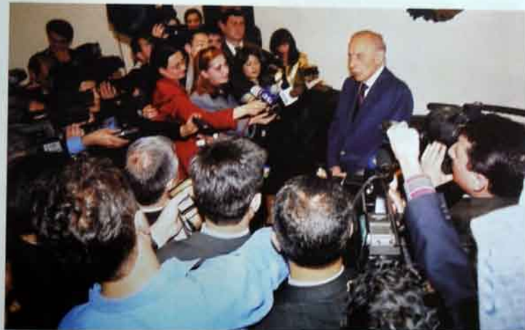
Aprəl, 2001-ci il, Bina hava limanında brifinq.