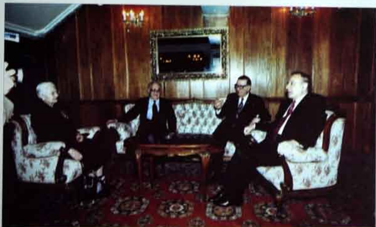
Heydər Əliyev sadəqətli həyat yoldaşı, gözəl ailsə başçısı, böyük dövlət xadimi olduğu kimi, həm də sadıq dost idi. Professor İhsan Doğramacı ilə.