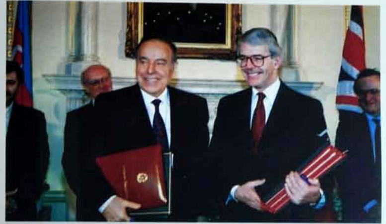
Böyük Britaniya Azərbaycana və onun prezidenti Heydər Əliyevə həmişə böyük sayğı ilə yanaşmış və bu sabəbsiz deyil. Böyük Britaniyanın baş naziri Con Meycorla iki ölkə arasında əməkdaşlığın inkişafını nəzərdə tutan sənədlərin imzalanması zamanı.

Süleyman DƏMİROL, Türkiyənin 9-cu prezidenti