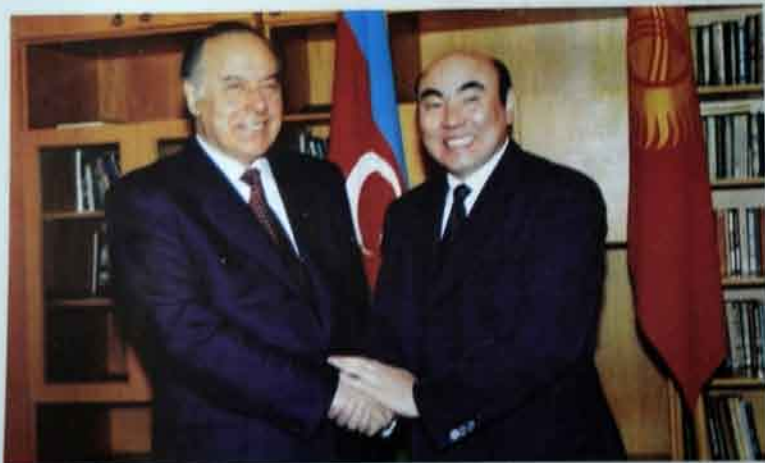
Qırğızstan Azərbaycan üçün qardaş ölkədir. Oğar Akayev prezident Heydər Əliyevlə hər görüşündə buna bir daha əmin olurdu.

Əziz qardaşım Heydər Əlirza oğlu, biz bundan sonra da qarşımıza çıxacaq hər bir məsələdə Sizinlə məsləhətləşərək bütün məsələləri aradan qaldırmağa çalışacağıq.