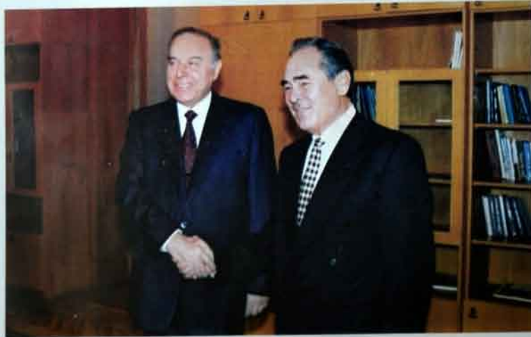
Tatarstan prezidenti Mintemir Şaymıyev Heydər Əliyevin məsləhətinə həmişə ehtiyac duyub.