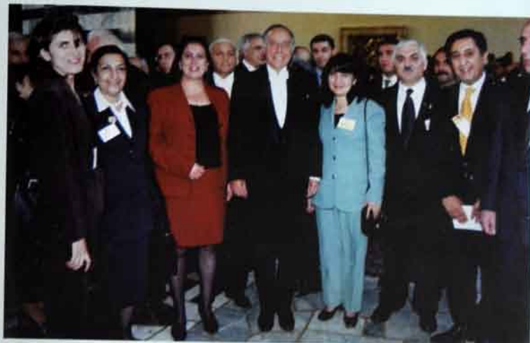
Prezident Heydər Əliyev jurnalistlərlə birgə.

Əvvəllər, onun rəhbərliyi ilə Azərbaycanda işlər yaxşı gedəndə, ovqatı yaxşı olurdu, tez-tez zarafat edirdi. Moskvağa gələndən sonra isə Əliyevin üzündəki təbəssüm azaldı. Paytaxıda Qorbaçovla münasibətləri düz gəlmirdi – SSRİ Nazirlər Soveti sōdrinin birinci müavini siyasi islahatların sürətləndirilməsini təqdır etmirdi. Bundan əlavə, Novorossiysk faciəsindən bir il