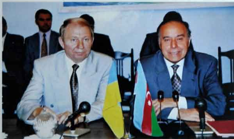
Ukrayna ilə Azərbaycanın münasibətləri strateji tərəfdaşlıq səviyyəsindədir. Ukrayna prezidenti Leonid Kuçma da bunu məhz Heydər Əliyevin zəhmətinin nəticəsi sayır.