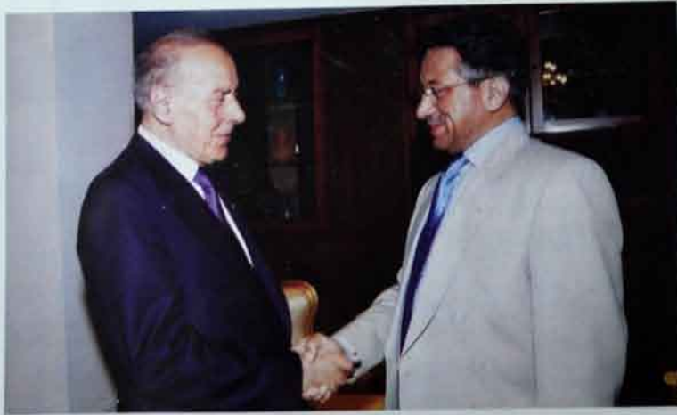
Pakistan Azərbaycanın dövlət müstəqilliyini tanıyan ilk ölkələrdən biridir. Prezident Parviz Mışərəff Bakıda, prezident sarayında qəbul edərək.