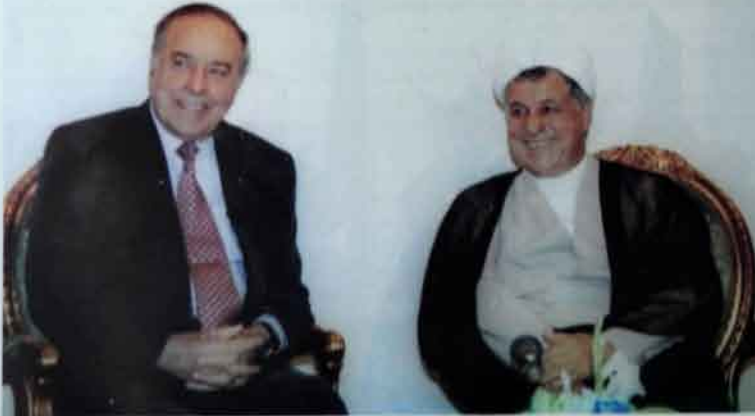
İran Azərbaycanla coğrafi anlamda çox yaxındır. Əkbər Həsəni Rəisancani ilə regionun tələyinə dair məsələləri müzakirə edərkən.

Sizinlə görüşürəm və ömürləşmişəm haqqında o qədər xatirələrim var ki: Ən birinci xatirəm isə, Sizinlə Azərbaycan yenidən müstəqilliyə çıxdıqdan dərhal sonra baş verən görüşümlə bağlıdır. Siz o zaman Naxçıvanda idiniz və yerli əhaliyə yardımın gətirilməsini təşkil edirdiniz. Mən ilk dəfə orada Sizinlə tanış oldum və birgə işlədim. Sizə elə o vaxtdan ürəkdən bağlandım, çünki mənə atamı xatırlatdınız. Ümid edirəm, bu haqiqəti söylədiyimə görə mənə inciməyəcəksiniz, doğrudan da ona bir qədər oxşarırsınız.