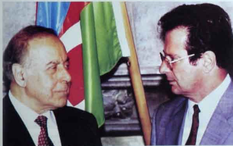
AFR-in xarici işlər naziri Klaus Kinkell.