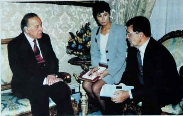
İtaliya prezidenti Roman Prodi ilə dünya siyasətinin ən mühüm məsələlərini müzakirə edərken.