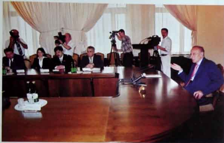
İyul, 2001-ci il. Jurnalistlərlə söhbət edərkən.