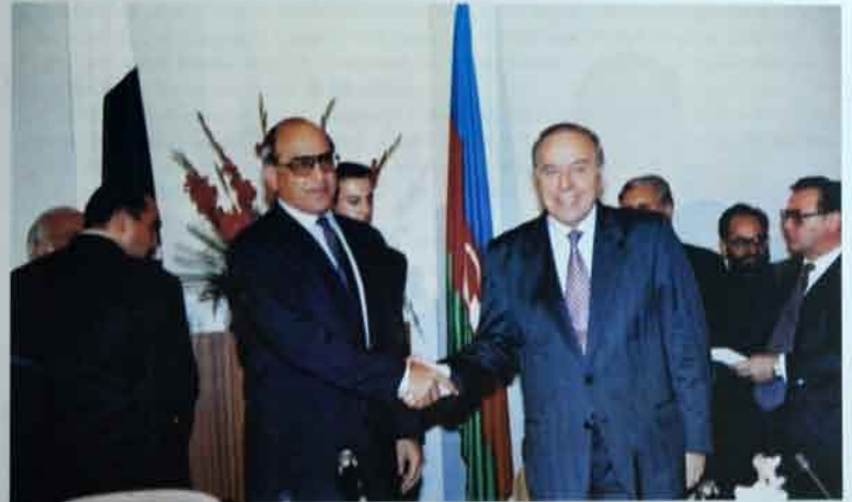
Pakistandan keçmiş prezidenti Ömər Şərif Azərbaycanın ölkəsi üçün etibarlı tərəfdaş olduğunu yaxşı anlıyır.