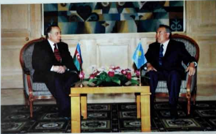
Nursultan Nazarbayev Heydər Əliyevdən çox şey öyrəndiyini dəfələrlə etiraf edib və görünür bu şəkildə omm sözlərini təsdiqləyən nüvbəti səhifələrdən biridir.