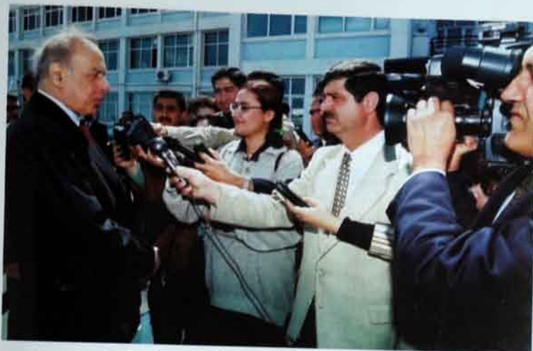
26 aprel 1998-ci il. Türkiyə səfəri öncəsi Bina hava limanında.

Heydər Əliyev bu məqsədin həyata keçirilməsi – əməl olunmamış xammalın sədəcə hasilatından miltina edərək, işin yeni normalarının, yeni texnologiyaların yaradılması uğrunda mübarizə aparmağa başlayır. Bu səhəfi ərəb dünyası 50-ci illərdə etmişdi. Respublika iqtisadiyyatını mo-