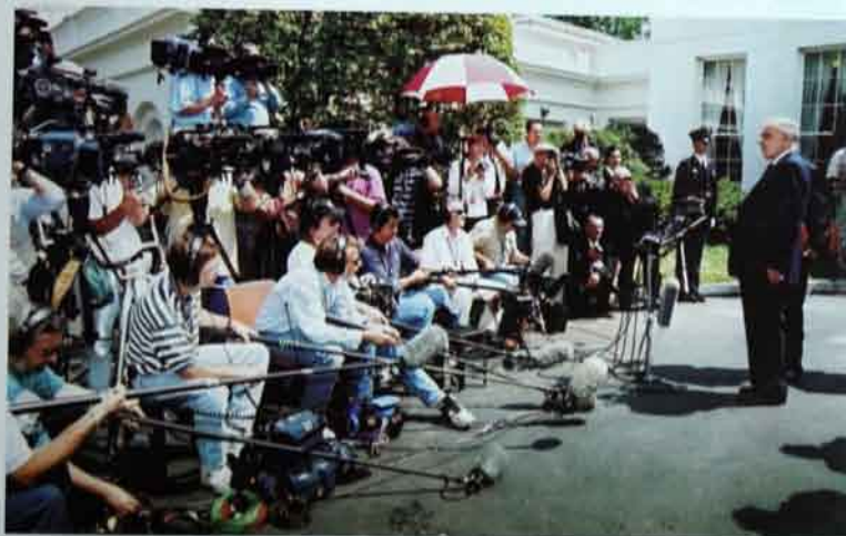
İyul, 1997-ci il. Aq evin qarşısında.