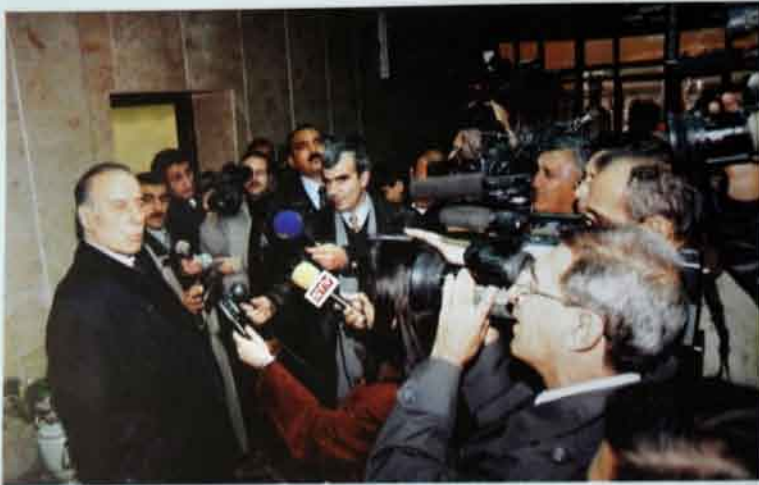
Oktyabr, 1999-cu il, Türkiyəyə səfərə gedərkən Bina hava limanında brifinq.