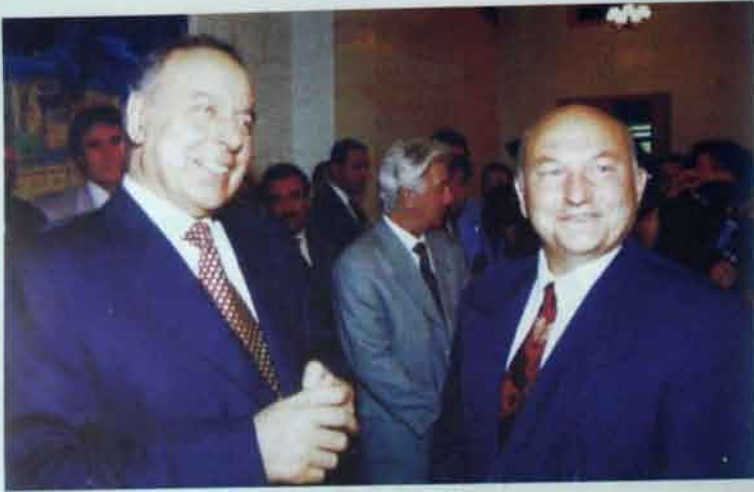
Moskva meri Yuri Lujkovla birlikdə.