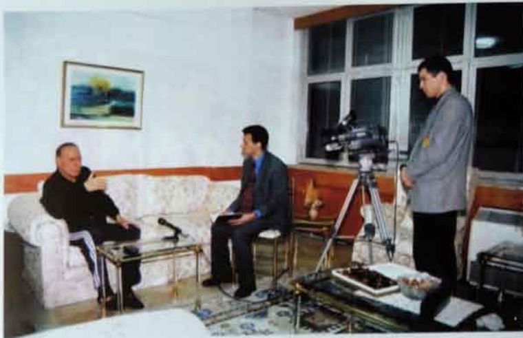
Yanvar, 1999-cü il, Türkiyə. ANS telekampaniyasına müsahibə verərkən.