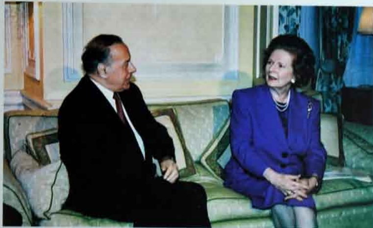
Böyük Britaniya ilə müttəfiq olmaq haqlıqatan böyük uğurdur. Bunu keçmiş baş nazir Marqaret Tetçer də yüksək qiymətləndirmişdi.

Heydər Əliyev 30 ildən çoxdur ki, öz ölkəsinin, eləcə də başqa ölkələrin həyatına həlledici, müsbət təsir göstərir. Mən Azərbaycan müstəqillik qazandıqdan onun oynadığı rolü xüsusi qeyd etmək istəyirəm.