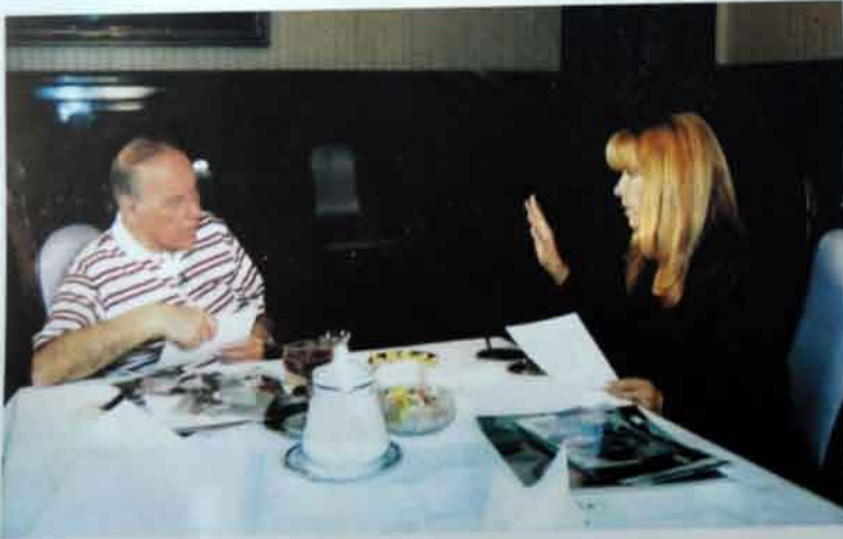
Heydər Əliyev istanbul sualı cavablandırmağa həmişə hazırdır.

1992-ci ildə Bakıya növbəti dəfə gəldikdə çox toqəcləndim: məşhur Bakı bulvarında, lap keçmişdən burada ucaldılmış, üstündə saat və termometr olan məşhur qüllənin yaxınlığında çayxana gözüme dəymədi. Bu, mənə cəlo güclü təsir bağışladı ki, o vaxtdan bəri Azərbaycan tarixini pürəngi çayın yoxa çıxması və yenidən peyda olması dövrlərinə bölməyə başladım. Yaxşı ki, artıq 1993-cü ildə sahil parkında çay içmək mümkün idi.