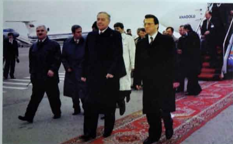
Türkiyənin baş naziri Masud Yılmaz Azərbaycana səfərə gəlarkən.