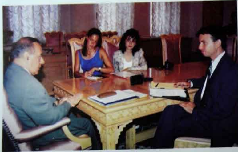
6 iyul, 1994-cü il. Xarici ölkə jurnalistlərinə müsahibə verərkən.