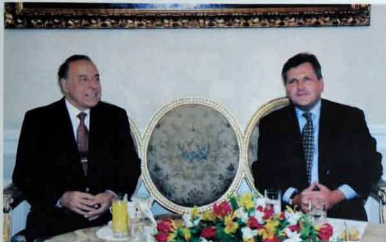
Aleksandr Kvasnevi Polşa prezidenti kimi Heydər Əliyevlə görüşmədən böyük qürur duyur.

Sizin bizə köməyiniz böyükdür. Türkmənistanın BMT-yə, İqtisadi Əməkdaşlıq Təşkilatına daxil olmasında, bitərəf dövlət statusu almasında şəxsən Sizin köməyiniz əvəzsiz və böyükdür.