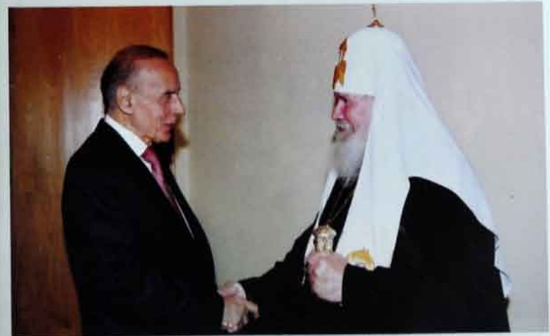
Azərbaycan bütün dinlərə hörmətli yanaşır. Elə Rusiyanın patriarxı 2-ci Aleksii də bunu dəfələrlə təsdiqləyib.