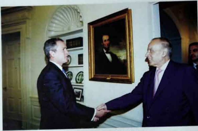
ABŞ Azərbaycanın strateji müttəfiqidir.