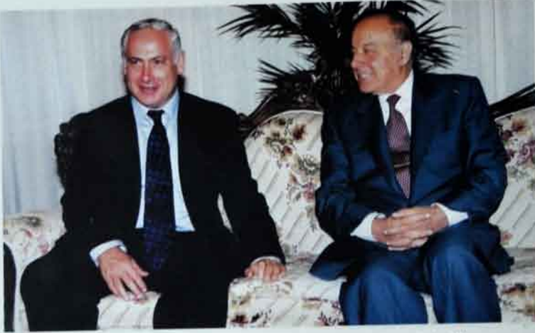
İsrailin keçmiş baş naziri Benyamin Netanyahu ilə Azərbaycan prezidenti Heydər Əliyev hər iki ölkənin qarşılaşdığı problemlərin həlli edəcəyinə əmindirlər.