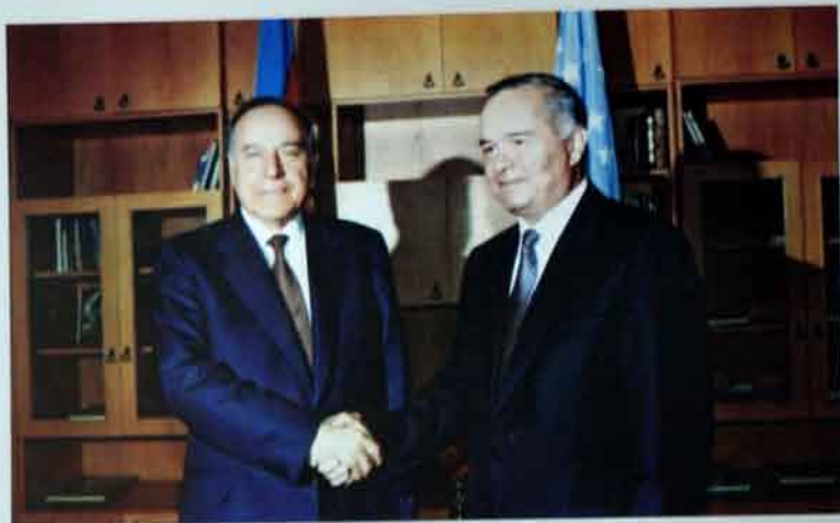
Heydər Əliyev təkcə Azərbaycan deyil, həm də bütün türk dünyasının tamamı liderlərindən idi. Özbəkistan prezidenti İslam Karimovla.