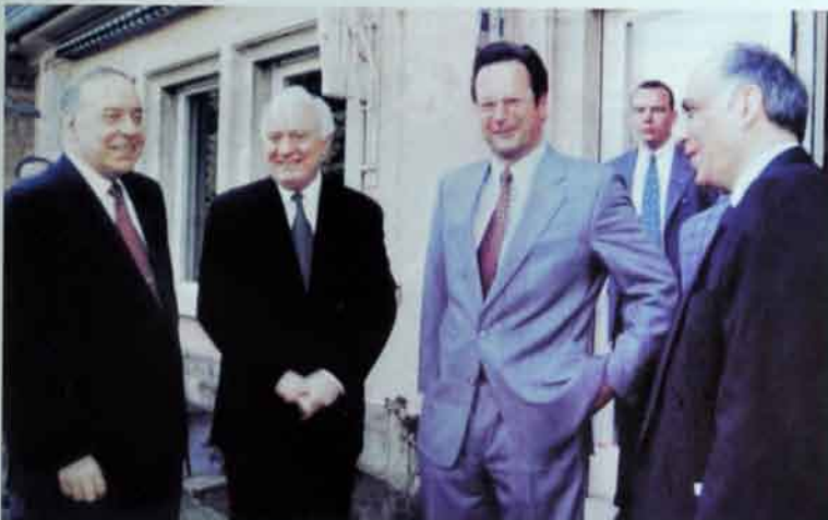
Gürcüstanla Azərbaycan həmişə problemlərini birgə müzakirə edirlər.