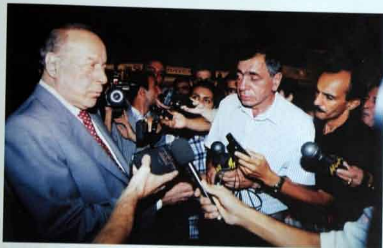
Avqust, 1997-ci il, Bina hava limanı. Jurnalistlər üçün brifinq.

Üstəlik, onların hər üçü – ABŞ, Rusiya və Fransa vasitəsilə Avropa bölgənin ən «qoc» və köklü konfliktli, mövcud status-kyonun başlıca «səbəbləri» olan Dağlıq Qarabağ münaqişəsinin nizamlanması üzrə vasitəçilər qrupunda təmsil olunurlar. Regiondakı sabitliyi xeyli «kövröldən» bu münaqişənin həlləməsi perspektivdə duran ən aktual problemdir və hər üç mərkəzin bu prosese özünəməxsus təsiri mövcuddur.