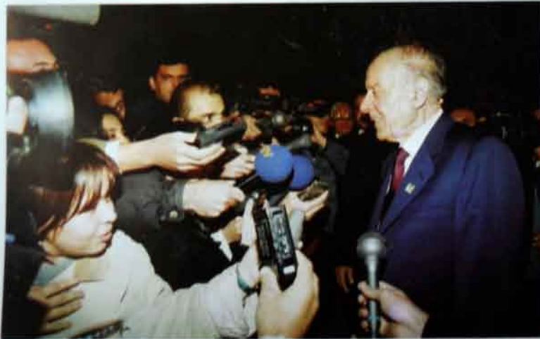
Noyabr 1999-cu il, Türkiyə, Səfərdən qayıdarkən.

əvvəl huyat yoldaşını torpağa tapşırırmışdı. Əliyev onu böyük ehtiramla xatırlayırdı: «O, mənim əsl dostum idi. Mən on öziz adamımı itirdim!»