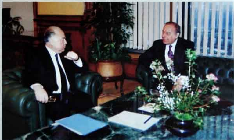
Rusiyanın sabiq baş naziri Viktor Çernomırdın üçün Heydər Əliyevlə danışmaq həmişə maraqlı və yaddaqalan olub.