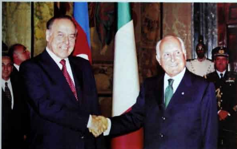
İtaliya prezidenti Oskar Luizi Skalfaro prezident Heydər Əliyevi öz ölkəsində görməkdən məmnundur.