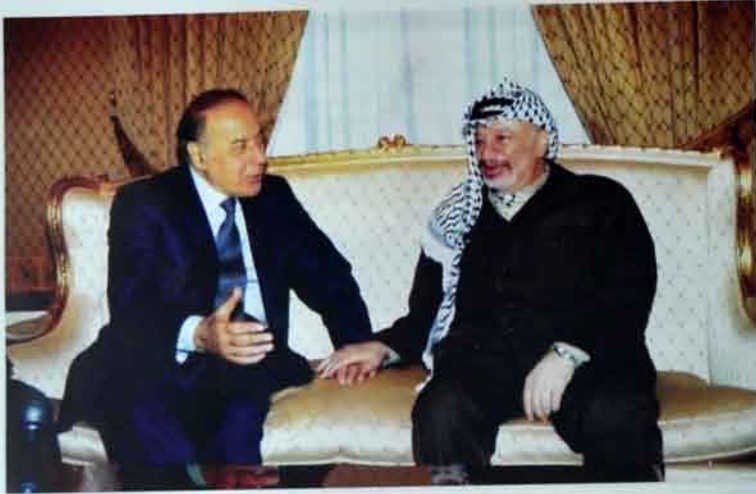
Fələstin lideri Yasir Ərafatla.