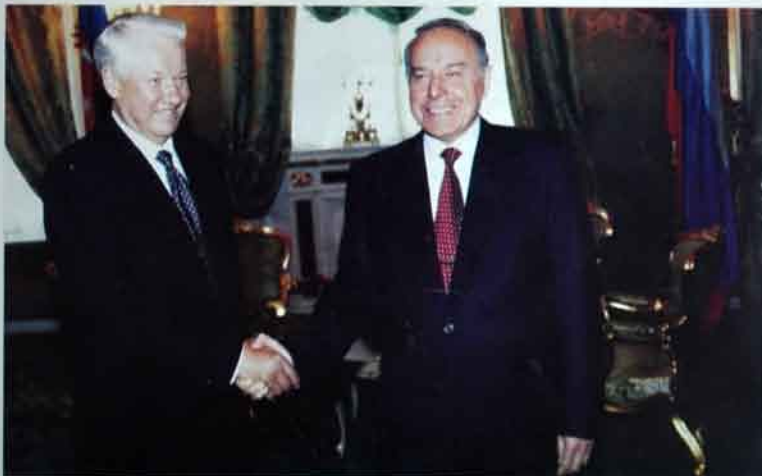
Azərbaycan Rusiya ilə yalnız yaxın qonşu yox, həm də tərəfdaşdır. Rusiyanın ilk prezidenti Boris Yeltsinlə.