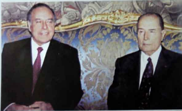
Heydər Əliyevin prezident kimi ilk safari Fransaya olmuşdu. Fransua Mitterran bunu çox yüksək qiymətləndirirdi.

Conab prezident, Əfqanıstanla bağlı danışıqlar, fikir mübadiləsindən sonra biz Sizinlə bu barədə böyük məmnuniyyətlə söhbət edərdik. Böyük məmnuniyyət hissi ilə Sizin məsləhətimizi öyrənərdik ki, həmin ölkənin təhlükəsizliyini necə təmin edərk.