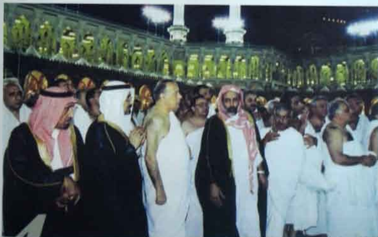
Heydər Əliyev hər zaman Haqqın yolunda olub.