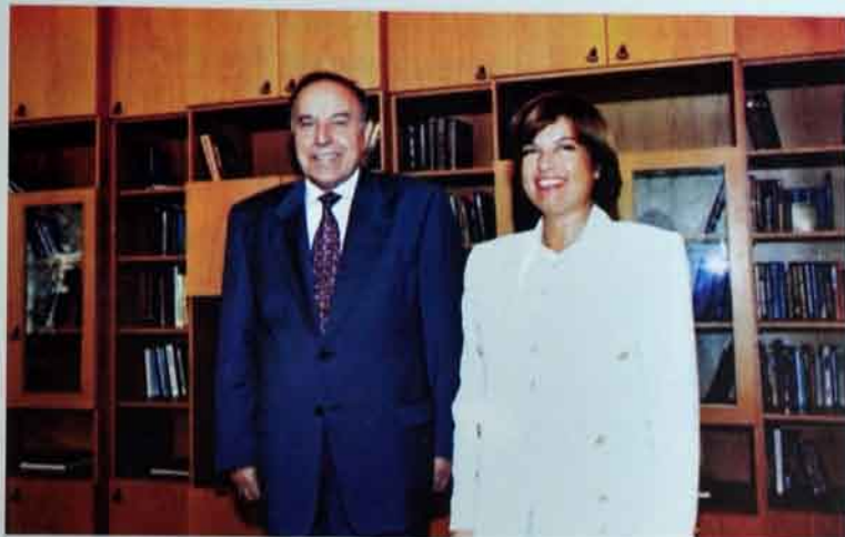
Türkiyənin dəmir edisi Tansu Çiller Heydər Əliyevi böyük siyasətçi kimi qbul edir.

Biz Sizi Azərbaycan millətinin fitri istedadı malik oğlu kimi tanıyırdıq. Elə bir oğul ki, o, Azərbaycan dövlətçiliyinin inkişafına özəvsiz töhfə vermişdir. Biz Sizi həm də sovet xalqının di-hi oğlu kimi xatırlayırdıq. Elə bir oğul ki, keçmiş dövlət rəhbərlərindən biri olarkən onun bütün xalqların inkişafına böyük töhfə vermişdir.