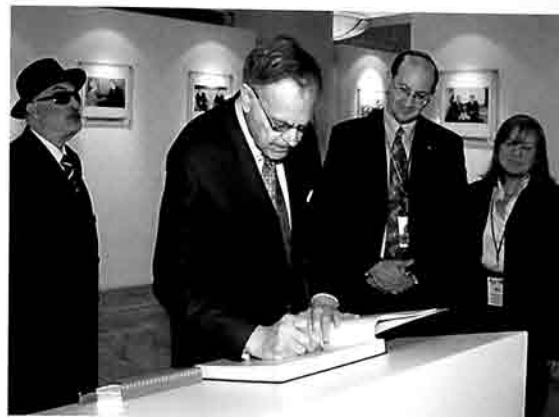
Azərbaycan Prezidentinə və xalqına böyük məhərtənliklə.

Harold Tanner for the Conference of Presidents of Major Jewish American Organizations