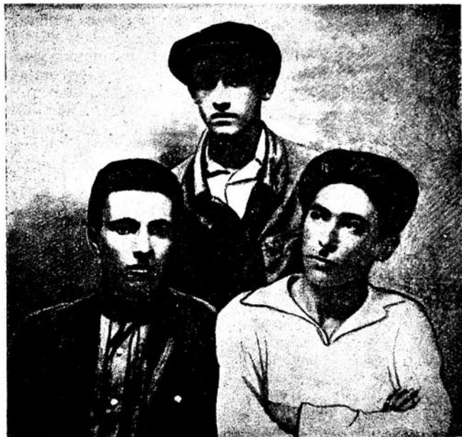
Шәкилдә: (сагдан) Сәмәд Вурғун, Әһмәд Чәмил вә Мир Чәлал (Кәнчә, 1927-чи ил)

хыр. Бундан сонра «Бой» (1935), «Дирилән адам» (1935), «Бостан оғрусу» (1937), «Көзүн айдын» (1939), «Бир кәнчин манифести» (1939), «Ачыг китаб» (1941) вә с. әсәрләри нәшр әдилир.