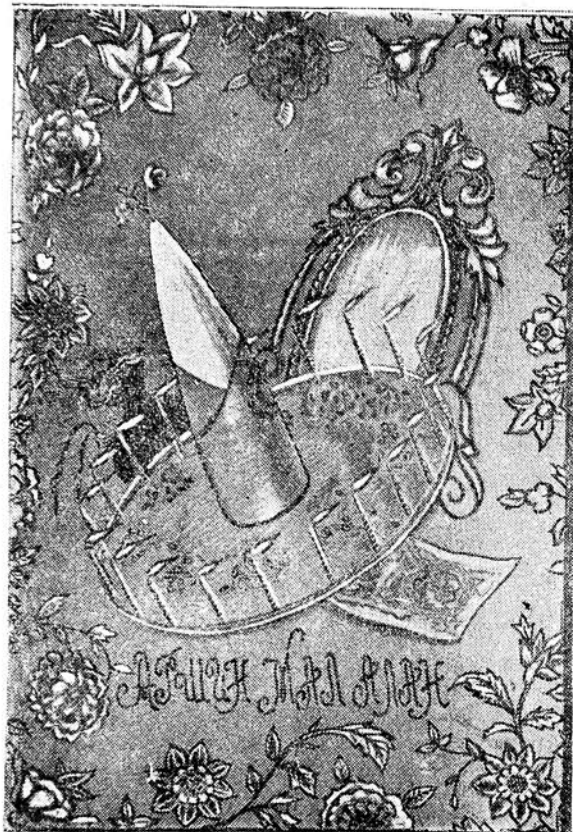
„Аршын мал алан“ китабынын үз габыгы

атында, «Аршын мал алан» һаггында чох дәрин мәз-мунлу рецензиялар верилмишдир. Москва гәзет-ләриндә дәрч олуна мөгәләләрин бирисиндә «Ар-шын мал алан» һаггында белә язылыр: «Азәрбай-чанлылар нә көвәл «күлүш» уstadларыдырлар. Бу тамашада о гәдәр һәгиги ити фикир вә күлүш, һәм артисләрин оюнунда һәм оркестрин мелодия-ларында, һәм рәссамын үрәк ачан вә парлаг деко-рацияларында чошгун шәнлик вардыр ки, «Аршын мал алан» тамашасына бахаркән, тамашачы гәшш өдирчәсинә күлүр».