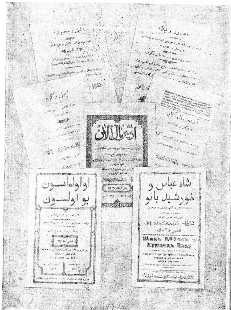
Үз. һачыбэйовун чап олунмуш эсэрлэринин үз габығы вэ титулларындан.

Тема э'тибарилэ һэтдан көтүрүлмүш бу оперетталар өз мээмуну вэ мусиги фактурасы э'тибарилэ чох марағлы олуб, феодал гайдалара, мүсәл-