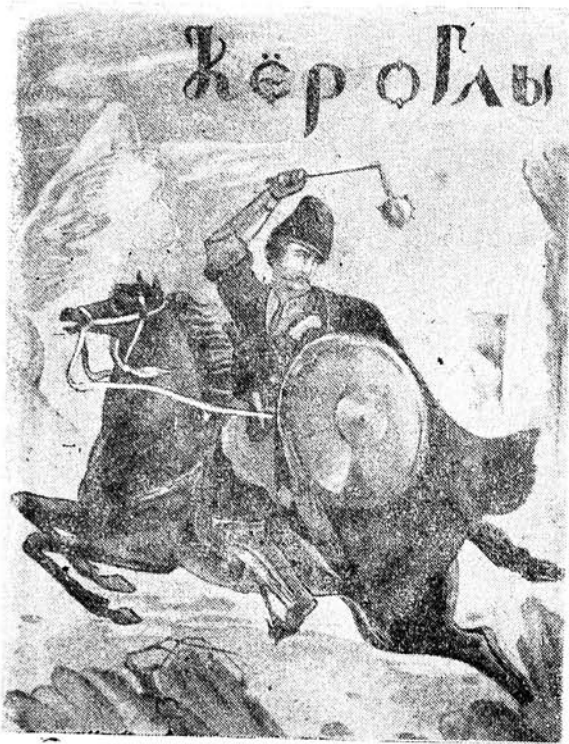
„Короғлу“ китабынын үз габыгы.

Сталин йолдашын фикрини чох билмэк истэйирдим, Лакин о гэдэр һэйэчанлы идим ки, «Короғлу» һаггында Сталин йолдаша биринчи олараг суал вермэйэ чэсарэт этмирдим. Сталин йолдаш, санки мөним фикрими дуймушду. Стол башында ян-яна отуран кими мэнэ деди ки, операм һаггында бир нечэ гейди вардыр. Мэн эзиз вэ севимли рәһбәримизи бөйүк үрәк һэйэчаны илә динләйирдим. «Короғлу» операсынын Сталин йолдаша чох хош кәлдийини эшитдикдә, үрәйими элә бир севинч һисси долдурду ки, буну сөзлә ифадә эдә билми-рәм.