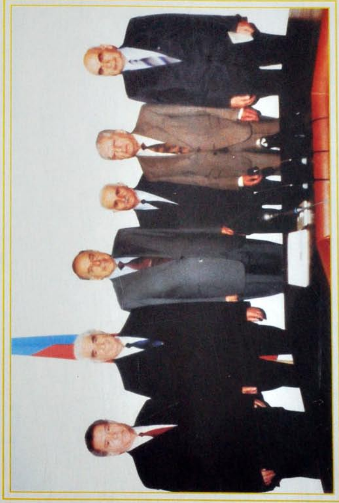
Azərbaycan Respublikası Prezidenti Heydər Əliyev Respublika Ağsaqqalları ilə görüşü, 1998.