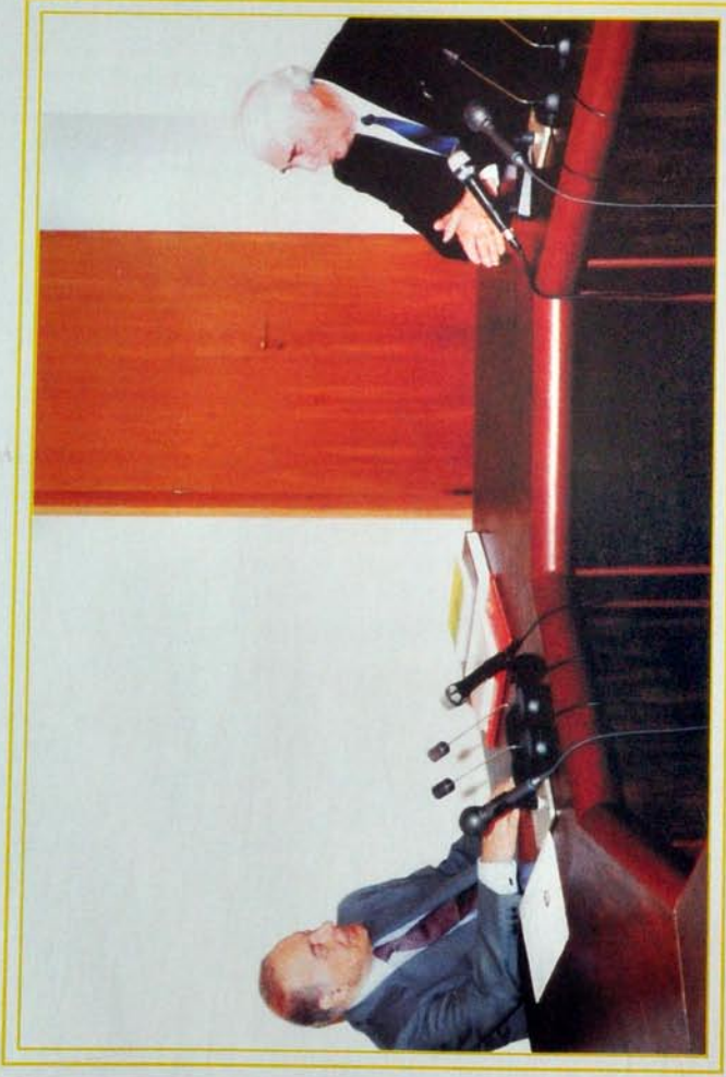
Azərbaycan Respublikası Prezidenti Heydər Əliyev Respublika Ağsaqqallar Şurasının sədri akademik Budaq Budaqovü qəbul edərkən.