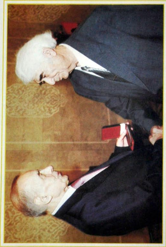
Azərbaycan Respublikası Prezidenti Heydər Əliyev akademik Budaq Budaqov "Şöhrət Ordeni" ilə təltif edərkən. 2001.

ballı tədqiqatların olmamasına çox təəssüflənirəm. Ermənistanda türkdilli tayfaların tarixi, müxtəlif dövrlərdə etnik proses və bu prosesdə həmin tayfaların iştirakı dərəcəsi, Azərbaycan xalqının və onun dilinin təşəkkülündə Ermənistanda yaşamış azərbaycanlıların mövqeyi məsələləri araşdırılmalıdır.