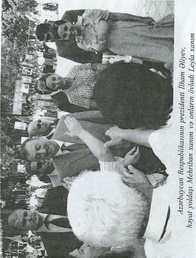
Azərbaycan Respublikasının prezidenti İlham Əliyev, həyat yoldaşı Mehriban xanım və onların övladı Leyla xanım