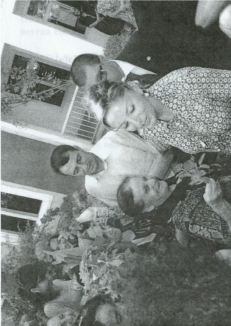
Azərbaycan Respublikasının birinci xanımı Mehriban Əliyeva