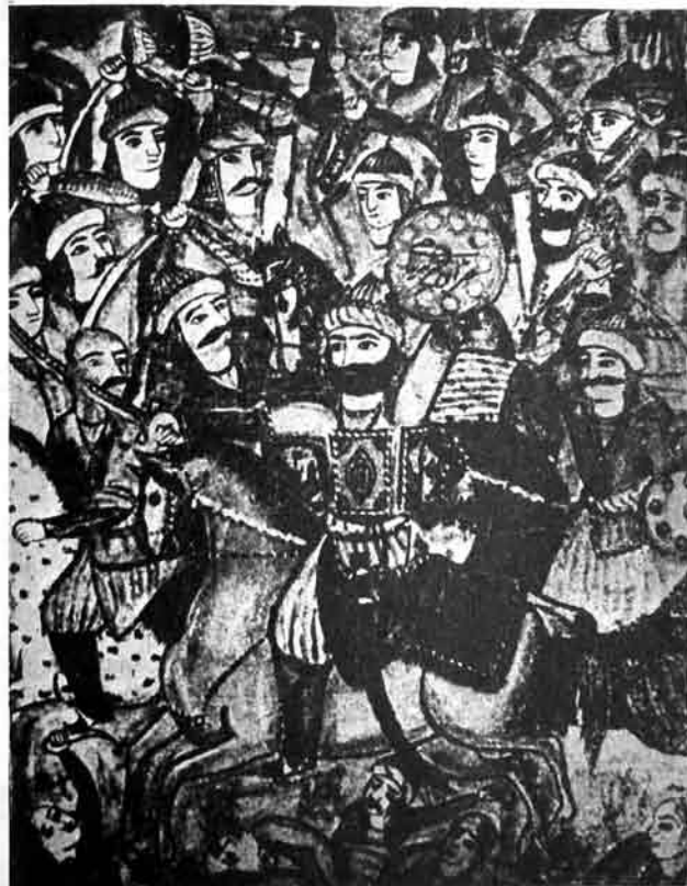
МӘШҺУР КУР ЈҮРҮШДӘ («Бәхр-ул-хәзан»ын әлјазмасындан, 1864)