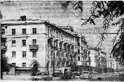
СОСНАЛИСТ БАКЫСЫ: Нәриманов проспектиндән бир көрунүш.