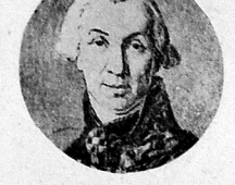
Г. Р. Державин