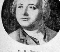
М. В. Ломоносов