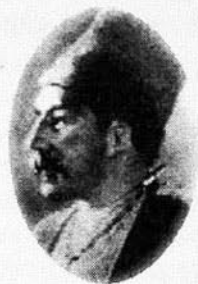
MİRZƏ ŞƏFİ VAZEH