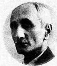
ABDULLA ŞAIQ 1881-1939

1909-cu ilin yayında Nəcəf bəy Vəzirovun təklifi ilə Abdulla Şaiq də öz ailəsi ilə Dağıstanın Daşlaqar yaylağına gedir. Bir gün Nəcəf bəy Daşlaqarın mənzərəli bir guşəsində qonaqlıq verir. Dağıstanın göz işlədikcə uzanan yaşıl bağları, qalın və sıx meşələri, uca və qarlı dağları görünən mənzərədən vəcdə gəlir, üzünü A. Şaiqə tutaraq deyir: