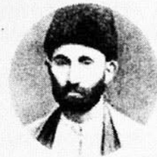
SEYİD ƏZİM ŞİRVANİ

– İnsanın musiqidən aldığı həzzi başqa heç bir şeylə əvəz etmək olmaz. Gör, nə günə qalmış ki, bu avam mollalar bizi dünyanın ən gözəl hissindən məhrum etməyə çalışırlar. Musiqidən nəinki insanlar, hətta heyvanlar və quşlar da təsirat alırlar. Lazım olduqda, musiqi ilə müalicə də edirlər. Mənim xəstə könlümü ilhamlandıran, məni yaşıdan, deyərdim ki, musiqidir.