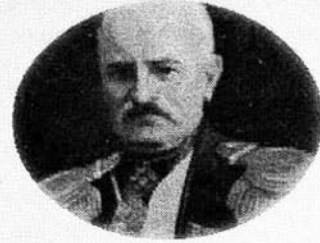
MİRZƏ FƏTƏLİ AXUNDZADƏ 1812-1878

Əgər görmək dilərsən surəti-Məcnuni-şeydanı Uzaq gəzmə, tamaşa qıl, budur ol aşiqi rusva. Şikəstə-xatirü məhzun, sözü aşüftə, digər qun, Tutub nəqşi-rəhi-Məcnun, gəzər vəhşi kimi səhra. Nəbati, həmd qıl-Allaha, min şükrü sənə eylə Ki, Məcnunun məqamini sənə ruzi edib mövla.