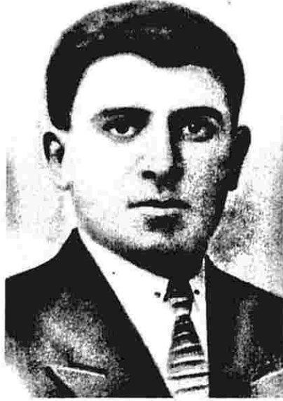
Yenə o bağ olaydı...