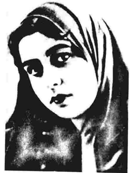
Dilbər Axundzadə (1931)

– Düz deyirsən, qısqanclıq pis şeydir: həm yaradıcılıq üçün, həm də sağlamlıq üçün, – dedi.