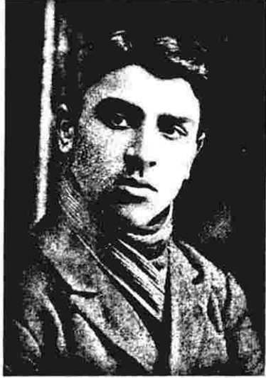
Mikayıl Müşfiqin gəncliyi

Biz müsamirənin başlanmağına hələ bir qədər qaldığını görüb, foyədə gəzirməyə başladıq. Pəncərənin qabağında bir neçə gənc dayanıb söhbət edirdi. Onların yanından ötəndə ortaboylu, enlikürək, qaragöz, qaraqaş, iti baxışlı bir gənc yoldaşlarından ayrılıb bizə sarı gəldi. Əmim arvadı bu gəncə çox səmimi görüşdü və onu bizə təqdim etdi: