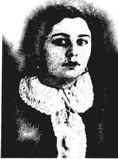
Dilbər xanımın Müşfiqli günləri

O mənə: «Yaxşı, mən getdim, sən də tez qayıt», - deyib uzaqlaşdı.