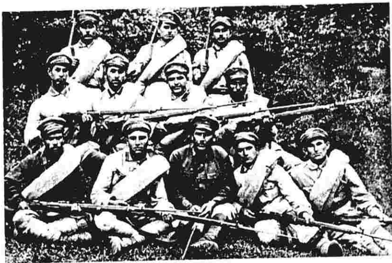
M.Müşfiq əsgəri xidmətdə. Birinci sırada soldan ikinci

dan «Neft-İliç buxtası», «Posyolka», «İşçi qız» şerlərini, «Buruqlar arasında» poemasını göstərmək olar.