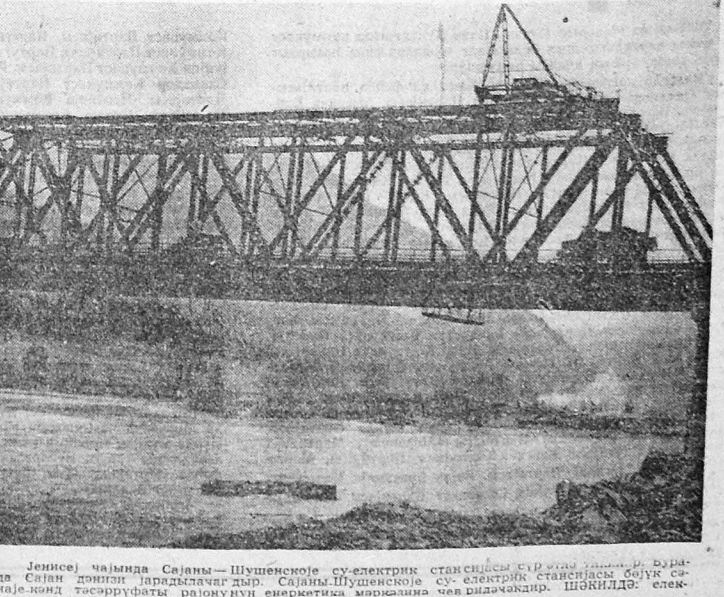
Јенисә чәһиндә Сәјәһи—Шүһәнәҗә су-электрик станциясы сурәтлә едиләр. Бурда Сәјәһи дәннәл йарадылағдыр. Сәјәһи-Шүһәнәҗә су-электрик станцияһы бөҗүк сә-һијә тәһрирәҗәтә рәһмунун енерҗиәһи мәһәһәтә чәһи чәһиләкдир. ШӘҒИДӘ: элек-трон станцияһынын тикитиси сәһә.

Мүәллиф һағы оларәг кәстәрир ки, мәдәни ин-гилаб иләриндә Азәр-бајҗанда һајата кәчирил-лә вә сонралар Шарғ өлкәләрини тәрәгисин-дә бөҗүк әһәмијәт кәб-дәк бир сыра тарихи тәдбирләрин, о чүмләдән әлифбада ишләбәт, га-дәһиләри тәһсиллә әл-дәһиләри вә башға мұ-һим тәдбирләрин иләк тә-һсиллә.