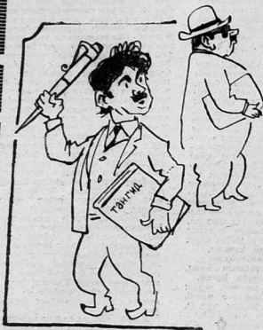
Бир сөз дөсөм дахи гојмаалар көндө...