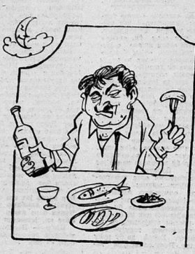
Хумар-хумар бахмаг көз гајасыдыр...