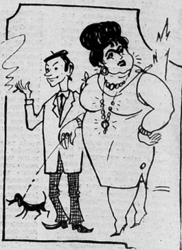
Тохи на Јашымаг, на чөкөниког, на утаниг Бөслөр бу дајаммаг!.. Шанклар И. НОЧӨФУЛУНУНДУР.