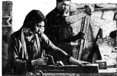
Naxşevan rəhbərliyində texniqumunda tələbələr praktik işlərdə

—Gətirin qoçanı. Sən vəkjin qarışından kəsəndə aqşırımam. Xanımə tək səz otol. 50 manat çərimə verməlisən. Birçə təbir ol.