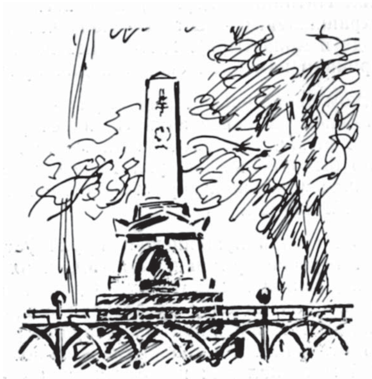
Sankt-Peterburqda duel yeri