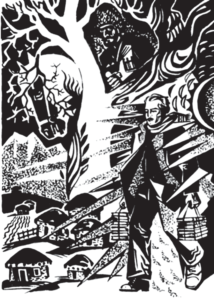
Rəssam: Elmas Hüseynov