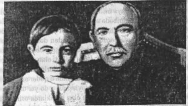
N.Nərimanov oğlu Nəcəflə birlikdə. Fevral 1925-ci il.

Azərbaycan tarixində elə bir fakt tapa bilmərik ki, Nərimanova kir gətirsin, o, bircə nəfər Azərbaycan ziyalisını məhv etmiş olsun və s. O, gələcək üçün yaşayırdı. Özü yazırdı: “Bəlkə də biz öləcəyik, lakin ona görə öləcəyik ki, yenidən həyata qayıdaq”. O, öldü, amma yenidən qayıtdı. O, öləndən sonra ta 1956-cı ilə qədər unuduldu, adı çəkilmədi, amma yenidən qayıtdı həyata.