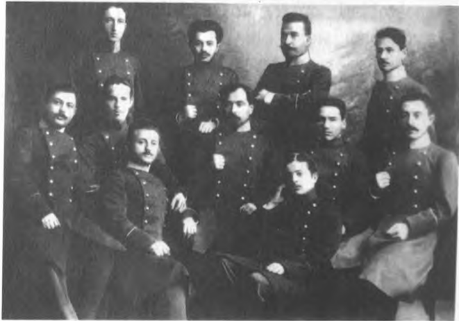
Nəriman Nərimanov (ortada) tələbə dostları arasında. Odessa. 1904-cü il.