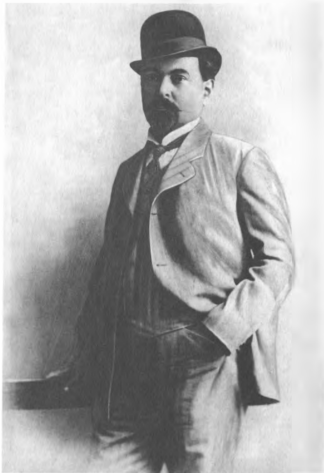
Nəriman Nərimanov. Həştərxan. 1910-cu il.