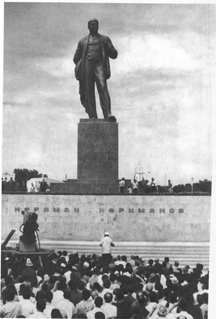
N.Nərimanovun 100 illiyi yubileyi günü heykəlin açılışı mərasimi. 1971-ci il.