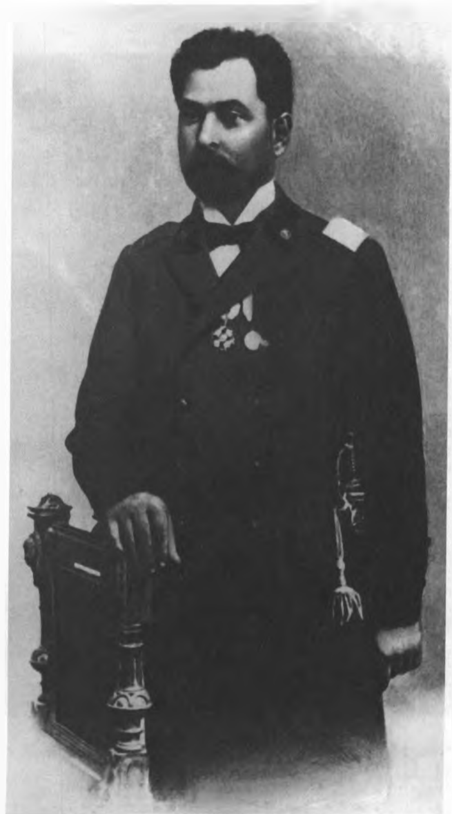
Nəriman Nərimanov. 1900-cü il.