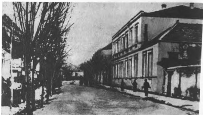
Qori. Zaqafqaziya müəllimlər seminariyası.