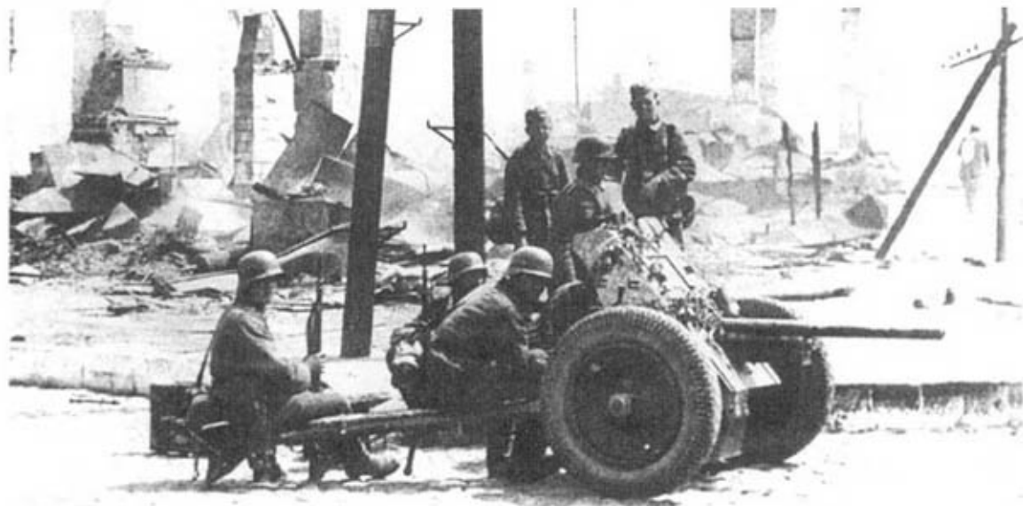
37-мм противотанковая пушка Pak35/36.

Артиллерию пехотных полков вермахта составляли 75-мм легкие пехотные орудия образца 1927 г. (I.G27) и 150-мм тяжелые пехотные орудия образца 1933 г. (s.I.G33). Дальность стрельбы этих орудий составляла соответственно 3550 и 4700 м, а скорострельность 12 и 3–4 выстрела в минуту. В каждом пехотном полку имелась рота в составе 3 взводов легких и 1 взвода тяжелых пехотных орудий. В каждом взводе было по 2 орудия. Кроме того, 2 легких пехотных орудия состояли на вооружении роты тяжелого оружия разведывательного дивизиона. Примерно с начала 1942 г. взводы лег-