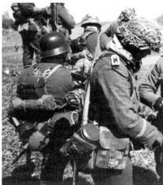
Облегченное пехотное снаряжение (реконструкция): у солдата (слева) — котелок, плащ-палатка в скатке, сухарная сумка, слева — противогаз, фляга. У фельдфебеля (справа) — шлем с веревочной сеткой, планшет. Сумка противооприпной накидки крепится к футляру противогаза.