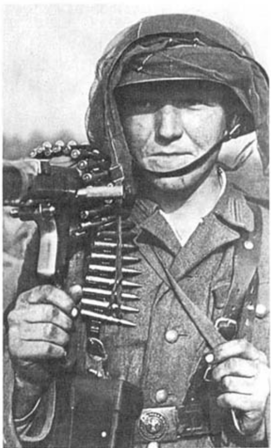
Пулеметчик. Восточный фронт, 1942 г. Стандартное армейское снаряжение с подсумком для принадлежностей к пулемету. На шлеме — москитная сетка.

Офицеры на поясе носили пистолетную кобуру (чаще всего под 9-мм «Вальтер» образца 1938 г.) и полевую сумку (планшет) образца 1935 г. из гладкой или зерненной кожи коричневого цвета. В конце войны получил распространение упрощенный «пресс-штоф» из коричневой кожи. Сумочка гауптфельдфебеля, в которой хранились списки личного состава и письменные принадлежности, креплений не имела и обычно закладывалась за борт кителя или куртки. Еще одной деталью снаряжения офицеров и старших унтер-офицеров был служебный фонарик с прямоугольным корпусом черного или защитного цвета (зимой — белого), с кожаной петлей сзади для пристегивания к пуговице одежды.