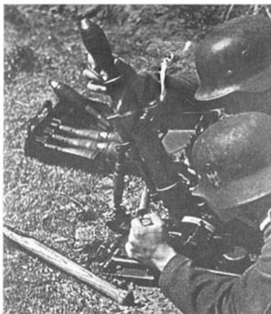
50-мм ротный миномет 1.GrW36.

компенсировался за счет использования трофейных образцов, таких как советские ППШ, британские «СТЭН» и итальянские «Беретта».