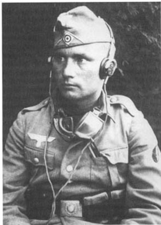
Радист батальона связи пехотной дивизии. 1941–1943 гг. Одет в куртку модификации 1940 г. и пилотку обр. 1938 г. На левом рукаве — знак специалиста. Защитные очки. На ремне — винтовочные подсумки.

Большинство из них было расформировано, а остальные — реорганизованы в дивизионные штабы особого назначения. Так, в период с октября 1944 по январь 1945 гг. возникло 15 таких штабов, которые получили номера с 601-го по 610-й и с 613-го по 617-й. Большая часть этих дивизионных штабов особого назначения, созданных на базе главных полевых комендатур, военных школ, штабов разгромленных дивизий и т. п., действовала на Восточном фронте.