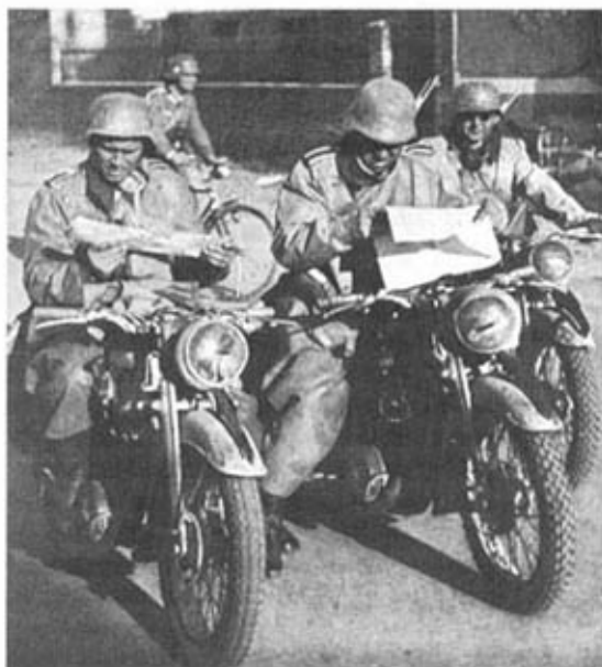
Мотоциклисты-разведчики на легких мотоциклах «Триумф». Франция, 1940 г. Одеты в прорезиненные плащи. На заднем плане виден самокатчик.

Из-за отсутствия резерва автотранспорта для частей, развертывавшихся с началом войны, приходилось мобилизовывать гражданский автотранспорт, который не был приспособлен для военных целей (так, например, в качестве тягачей для противотанковых орудий и другого тяжелого оружия использовались легковые автомобили). Нехватка автотранспорта продолжала сказываться на протяжении всей войны. В качестве временного выхода из положения в период подготовки к осуществлению операции «Барбаросса» стали в большом количестве применяться трофейные автомашины, однако отсутствие запасных частей серьезно затрудняло их ремонт. Использование автомашин, поступавших с французских автомобилестроительных заводов, также не решало проблемы, поскольку они, как правило, не отвечали требованиям, которые предъявляли к автотранспорту русские дороги. Тем не менее, в июне 1941 г. 88 пехотных дивизий были оснащены преимущественно автомашинами трофейными или французского производства.