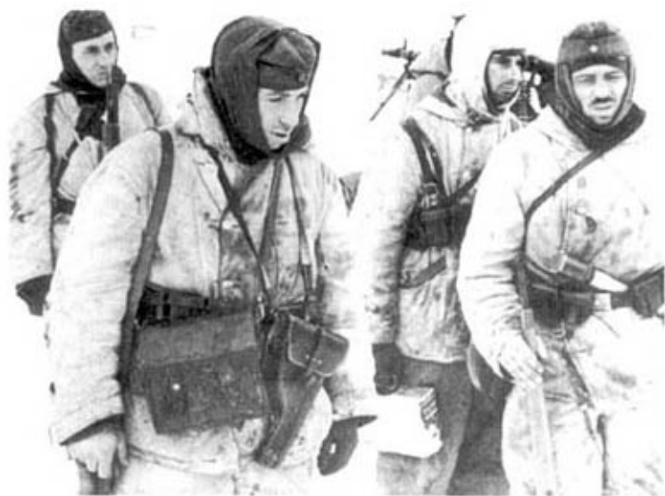
Германские пехотинцы в Сталинградском котле. Зима 1942–1943 г. Одеты в двусторонние утепленные костюмы, пилотки обр. 1938 г. У стоящего на переднем плане видна кобура ракетицы.

расформированы и использованы для восстановления двух уничтоженных под Сталинградом моторизованных дивизий.