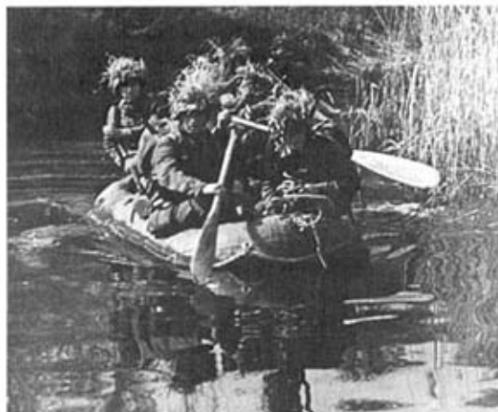
Германские пехотинцы на резиновой лодке форсируют одну из многочисленных рек Бельгии. Май 1940 г. На шлемах солдат — листовенно-травяной камуфляж.

соответствующий контингент из этих подразделений. Они комплектовались главным образом за счет резервистов 2-го разряда и в незначительной степени — 1-го разряда; недостающая часть пополнялась за счет военнообязанных ландвера. Организация этих дивизий была подобна организации дивизий 1-й и 2-й волн, однако отсутствие в мирное время штабов всех степеней (кроме штабов батальонов) и неподготовленность учебных подразделений к действиям в составе частей и соединений приводили к тому, что эти дивизии, в противоположность дивизиям 2-й волны, первое время имели серьезные недостатки в управлении и боевой подготовке.*