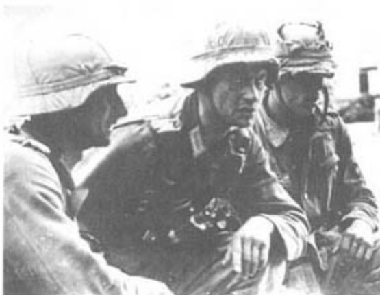
Два офицера и обер-гренадер. Восточный фронт, 1943 г. На шлемах — камуфляжные чехлы. У лейтенанта (в центре) на груди бинокль и фонарик. Видна ленточка Железного Креста II класса.

обладали очень ограниченной подвижностью. Экономия личного состава, вооружения и автотранспорта, которой руководствовались при создании стационарных дивизий, в конечном итоге обернулась серьезными издержками сил и средств из-за невозможности правильного использования этих формирований. В результате в тылу фронта обороны побережья не оказалось сильных подвижных резервов для контр-удара, а уровень боевой подготовки имевшихся дивизий уже не отвечал условиям тяжелых боев, которые им предстояло вести против противника, намного превосходившего их в численном и техническом отношении.