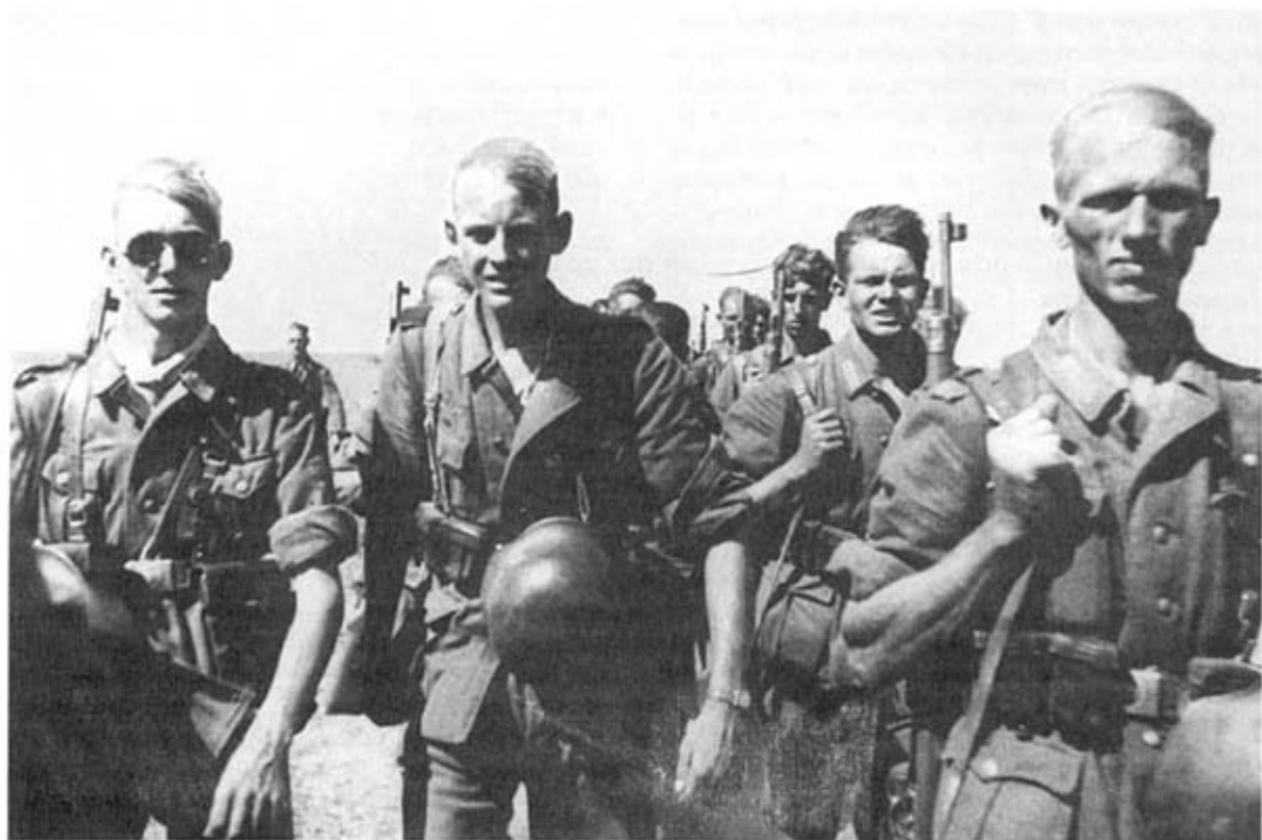
Пехотное подразделение вермахта на марше. Восточный фронт, лето 1942 г. На солдатах куртки модификации 1940 г. и стандартное пехотное снаряжение с винтовочными подсумками.

174, 182, 187, 189, 191), которые были переброшены в рейхскомиссариаты (4 дивизии), генерал-губернаторство (3 дивизии), а также в оккупированные области, находившиеся под управлением командующих войсками на Западе (10 дивизий) и на Балканах (1 дивизия). Командующий армией резерва осуществлял руководство этими формированиями через командующих германскими войсками на местах. Остальные запасные части были сведены в дивизии, находившиеся на имперской территории Германии (включая Данциг, Познань, протекторат Богемия и Моравия) и в Дании. Кроме того, в некоторых военных округах были созданы дивизии особого назначения.