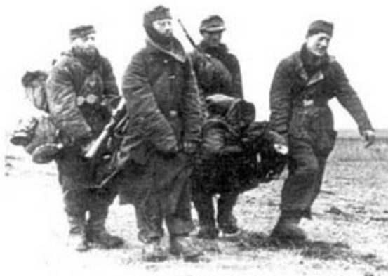
Германские солдаты выносят с поля боя раненого товарища. Украина, весна 1944 г. Все, кроме солдата на переднем плане, одеты в двусторонние утепленные костюмы.

го камуфляжа на шлемах носили эластичные и затяжные ободки.