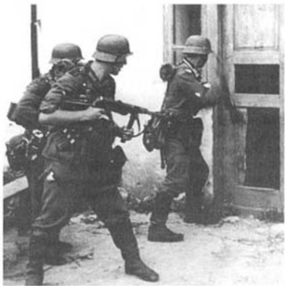
Германские пехотинцы прочесывают жилые кварталы. Восточный фронт, 1941 г.

Боевые действия в период наступления группы армий «Центр» на Москву в октябре — ноябре 1941 г., как и ранее, характеризовались большими потерями. В результате численность стрелковых рот за два месяца боев сократилась в среднем до 50–60 человек, а общая боеспособность пехотных дивизий, по оценкам Генштаба ОКХ, снизилась до 65 % от первоначальной. В начале ноября к этому прибавились неблагоприятные погодные условия, осенняя распутица, во время которой из-за дождей и снега дороги стали полностью непроходимыми. Германская армия оказалась совершенно не подготовленной к суровым климатическим условиям России и поплатилась за это ценой физического изнеможения людей и износа техники. Наступившие затем сильные холода поставили войска перед новыми серьезными трудностями. Несмотря на то, что до начала