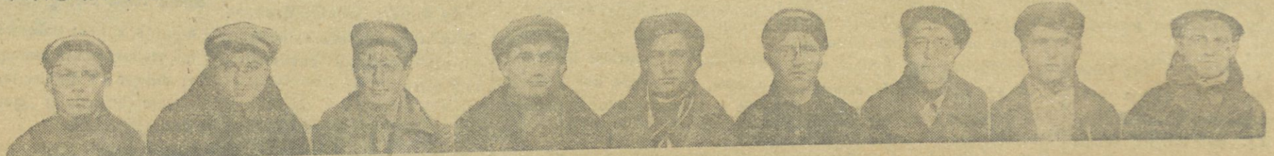
Umyim Ermənistan sovxozlar muşavərəsinə qəlmis zərbəçilərdən.

Məşevik əqs inkılabçyların hərəqətləri syralar ittifakı proletarjaya məlym oldygy qibi Moskvada, Minskədə və diqər bir çok şəhərlərdə protesto numajışları və mitinglər olmyşdyr. İrevan zavodlarında və bir çok muşessələrdə mitinglər olyb, işçilər əqs inkılabçyların ağır syrətdə cəzalandırılması tələb edirlər.