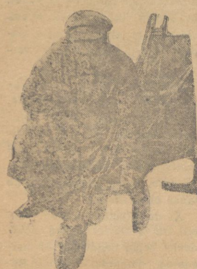
Jaz əqinə hazırləşır

Cahan muharəbəsinə əvvəldən axıra kədər zidd olan bolşeviklər həmin muharəbənin kyrtarması üçün jenedə işci sınıfı başında dıymış idi. Fəkat bir tərəfdən 1907-nci ildən 1910-ncy ilə kədər irticailiq, diqər tərəfdən isə cahan muharəbəsi, sosial demokrat (b) firkəsinə ağır zərbə olyb, zəif bir hala salmışdır. Proletarjatan jəlançə „dostlar“, menşeviklər isə təmamilə byrzyazja laqerinə qəçib, proletarjatı safdılar.