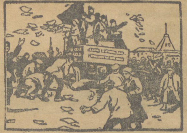
1917-nci il fevral inkilabı qunları, Petrograd qəçələrində

və zəhmətqes qəndliləri butunluqda dənçi halına salmaqla, əlqə təmamilə təxribətə yğrajaraq insanlar adam əti belə jəməqə məcbyr olırdılar.