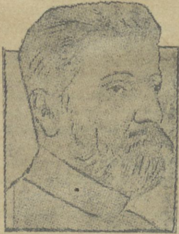
Zak. Xalk Komissarlar Şyrası sədri: ORAXELASHVILI joldaş

Qurcustan, Azərbaycan və Ermenistanın təbiət-coğrafi şəraitləri ojdəyiq, by cumhyriyyətlərin biri — biriylə sikkə iktisadi əlakələri olmamadan istehsalat kuvvələrini artıryb, tərəkki etmələri gəjri mümkündür. Bynu müsavət, daşnak və mənşevik firkələrinin həqumranlıq devri bir daha suhyt etdi.