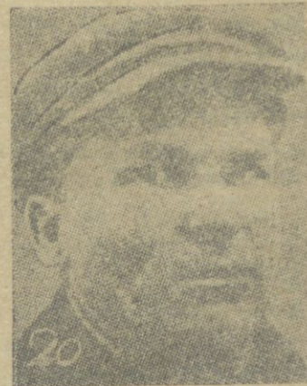
Zakfederasiya təşqilatçylarından QIROF joldaş

Turq okucylar rıscadan başkə, qutubxanənin turq bəlməsinə dəndə istifadə edəbilir.